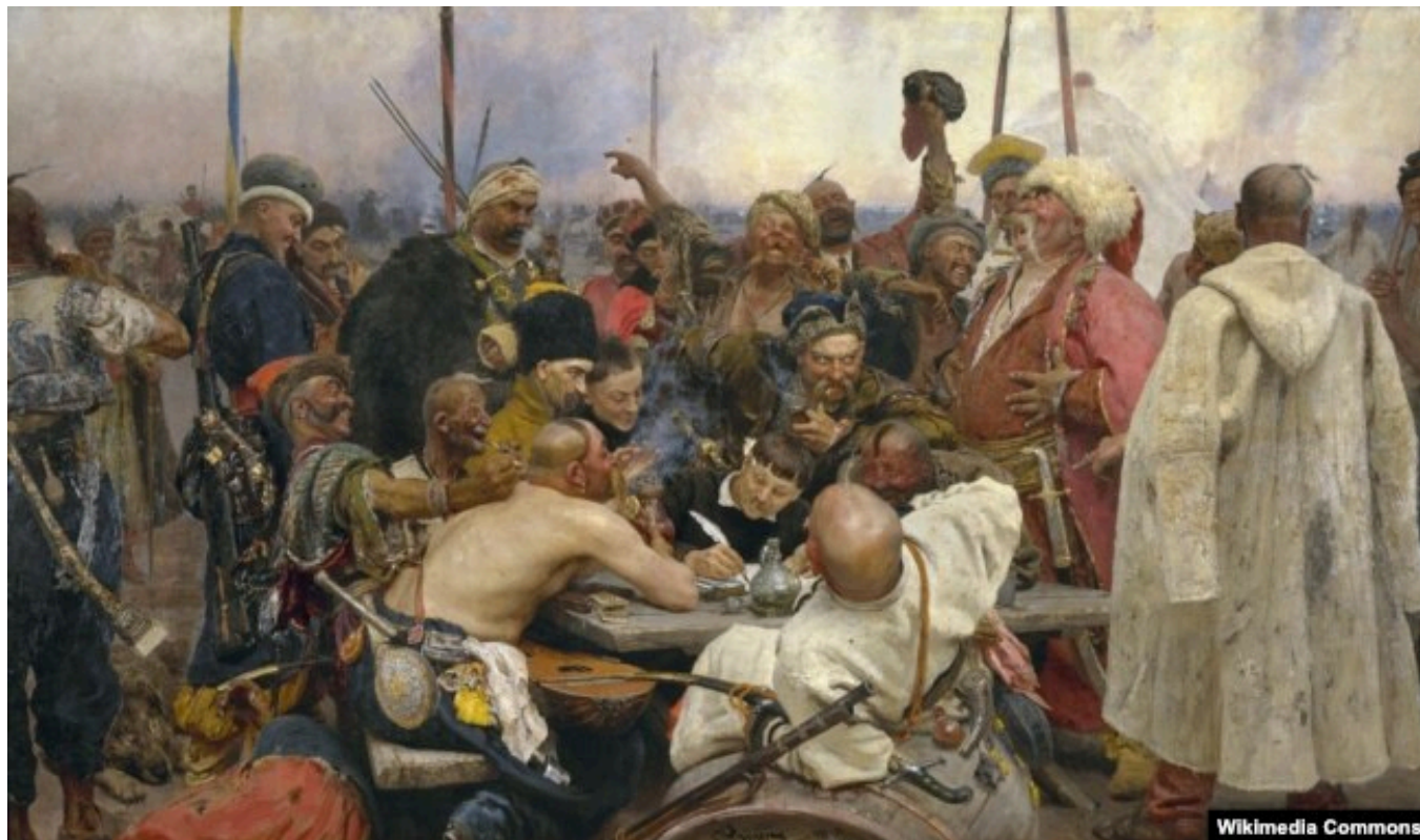
"Запорожцы пишут письмо турецкому султану", картина Ильи Репина