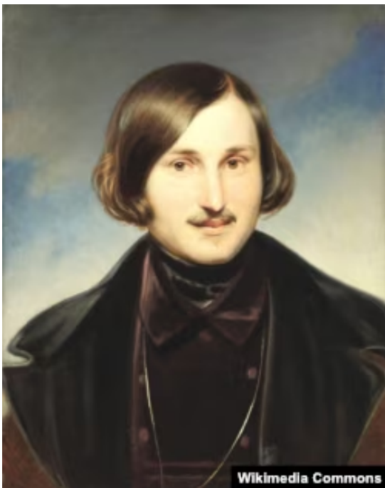
Портрет Николая Гоголя, 1840-е гг. Автор Федор Моллер

Павла Скоропадского, полковника Евгения Коновальца, проводника ОУН Степана Бандеры и других украинцев.