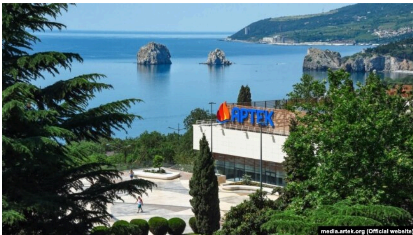
Центр детского отдыха "Артек"

"Организован плановый вывоз детей из "Артека" к местам постоянного проживания. На всем пути следования сопровождающих координируют представители спецслужб. Принимаются все необходимые меры, направленные на обеспечение безопасности и комфорта детей в период их возвращения", – сообщили в Минпросвещения РФ.