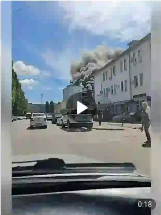
Воронеж, завод горит.