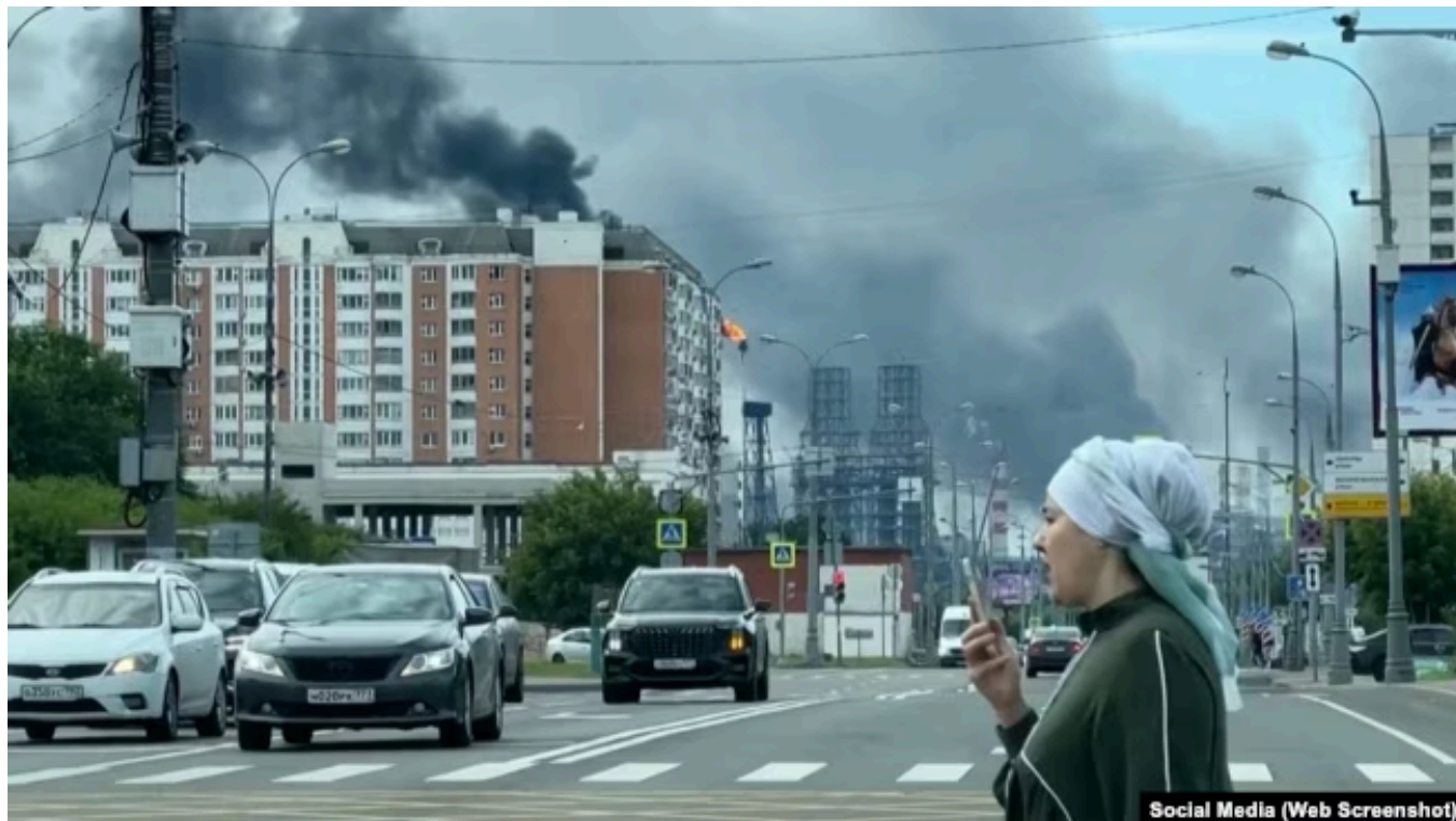
Улицы Москвы близи Капотни, 18 июня 2026 года