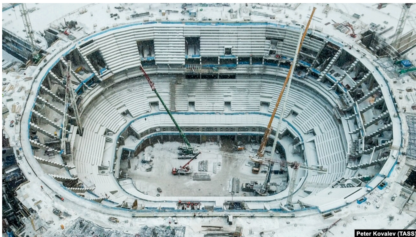
Строительство СКА-Арены, декабрь 2021 года

Радость петербургских хоккеистов от новой арены объяснима. Предложение о том, что клуб получит в долгосрочную аренду спортивно-концертный комплекс "Петербургский" для создания на его месте современной ледовой арены появилось еще в 2017 году, но стройка длилась 6 лет. СКК "Петербургский" был снесен, и "СКА-арена", строительство которой постоянно дорожало , была открыта только осенью 2023 года. Утверждается , что она стала самой большой хоккейной ареной в мире.