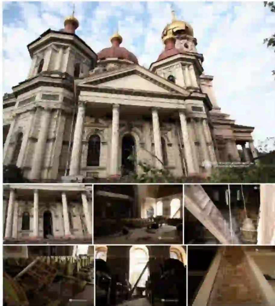
Через нічну атаку росіян понівечений і Будинок

Россия в ночь на 15 июня запустила по Украине 70 ракет (шесть противокорабельных ракет ЗМ22 "Циркон", 34 баллистические ракеты "Искандер-М/С-400", 30 крылатых ракет "Х-101/Искандер-К") и 611 беспилотников, из них сбиты 50 ракет и 582 дрона, сообщили в Воздушных силах ВСУ.