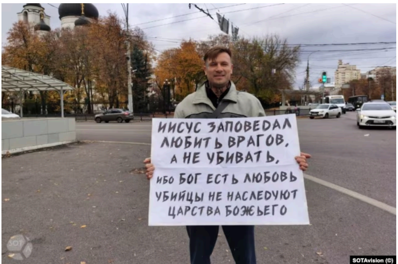
Блогер Веган Христолюб Божий