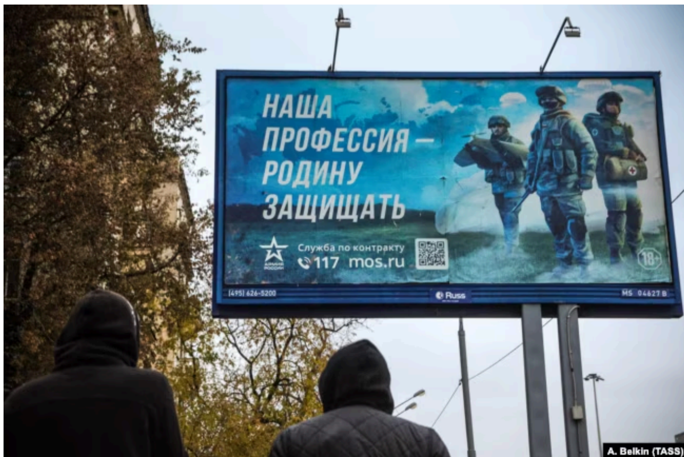
Билборд с информацией о наборе на военную службу по контракту на Ленинградском проспекте в Москве.

Это абсолютно коррупционная схема, суть которой исключительно в отмывании бабок. Никакого другого другого смысла в этом нет. Ну и как следствие, естественно, он не работает. Если бы он работал, мы бы видели, помимо историй про мобилизационные предписания, угрозы, панику, мы бы видели критическую массу всяких разных запретов, а не только, условно, за год пару-тройку десятков на несколько сотен, как минимум, случаев, когда людей не выпускали страны. Ну, это несерьезно!