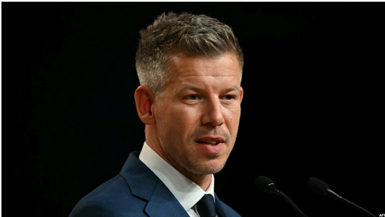
Премьер-министр Венгрии Петер Мадьяр

Будапешт и Киев достигли соглашения о расширении языковых, образовательных, культурных и политических прав венгерского меньшинства в Украине. Согласно договоренностям, образовательные учреждения с классами и группами на венгерском языке получат статус школы нацменьшинства, а ученикам школ разрешат коммуницировать на родном языке и использовать венгерскую символику, пишет украинская служба Радио Свобода со ссылкой на 20-страничный документ.