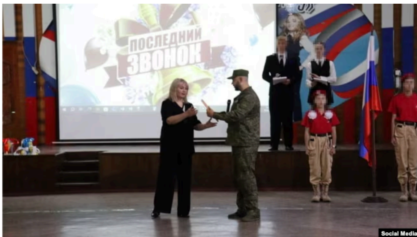
Последний звонок в Лицее №3 города Шахты Ростовской области

В Шахтах Ростовской области родители и учителя организовали акцию "Помощь бойцам СВО вместо букетов": они отказались от покупки цветов, а деньги передали на покупку техники в штурмовой отряд.