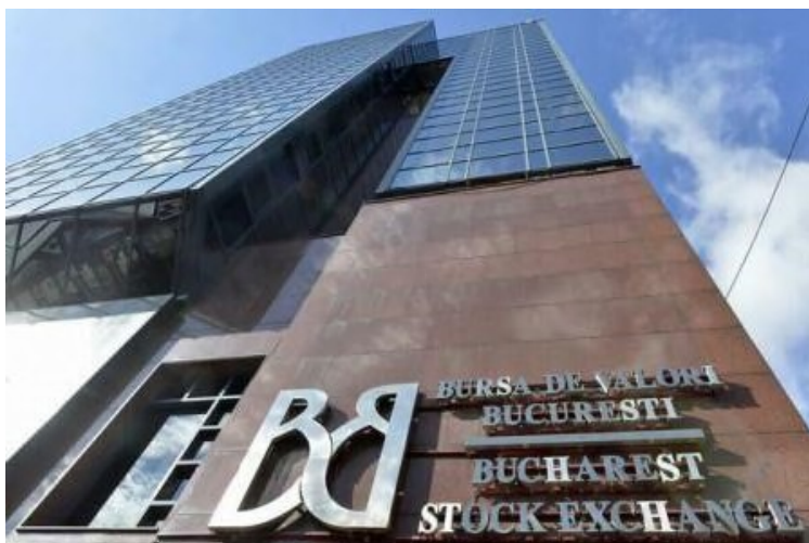
Figura 5: International Business Center Modern SRL