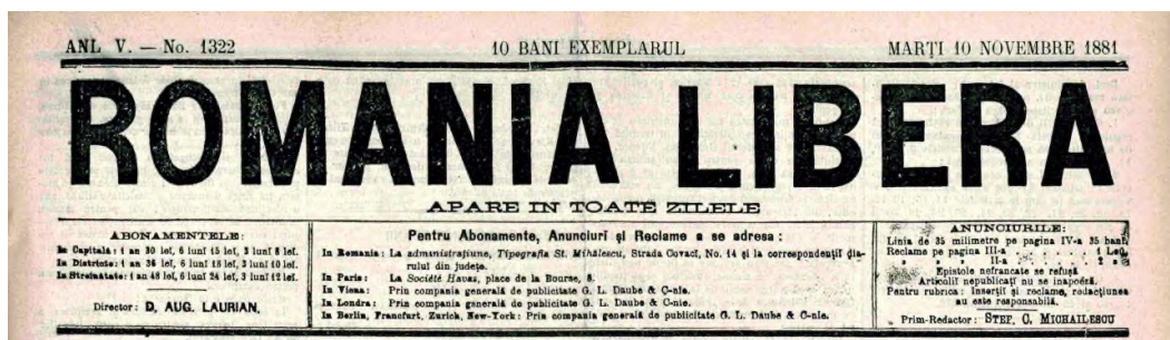
Figura 1: Antetul ziarului România Liberă, 10 noiembrie 1881