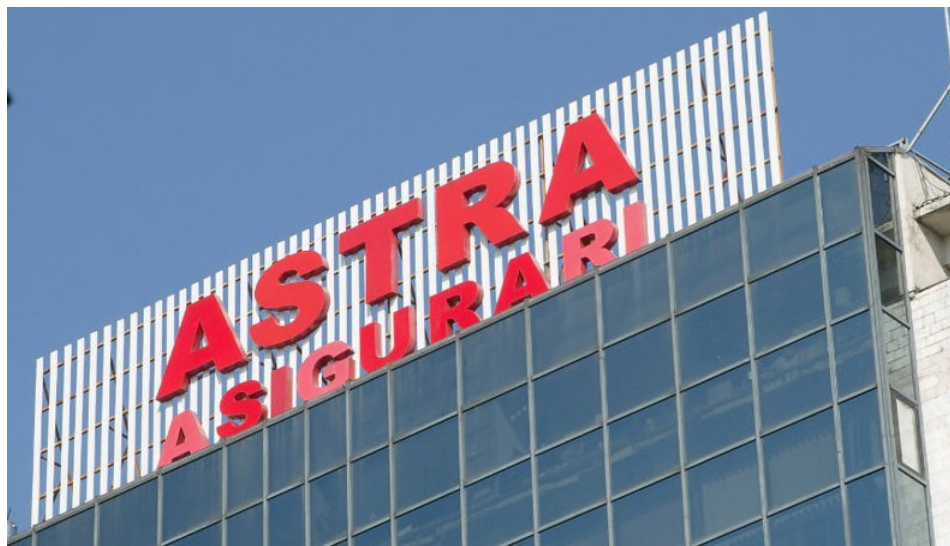
Figura 2: Imaginea Astra Asigurări, City Business Center

68. Cu toate că România Liberă a fost una din primele și cele mai importante ale lui Dan Adamescu în România, giuvaerul coroanei investițiilor The Nova Group urma să devină Astra.