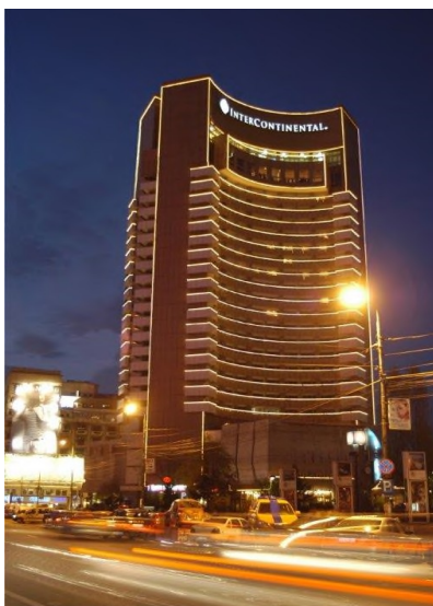
Figura 4: Imaginea Hotelului Intercontinental, București