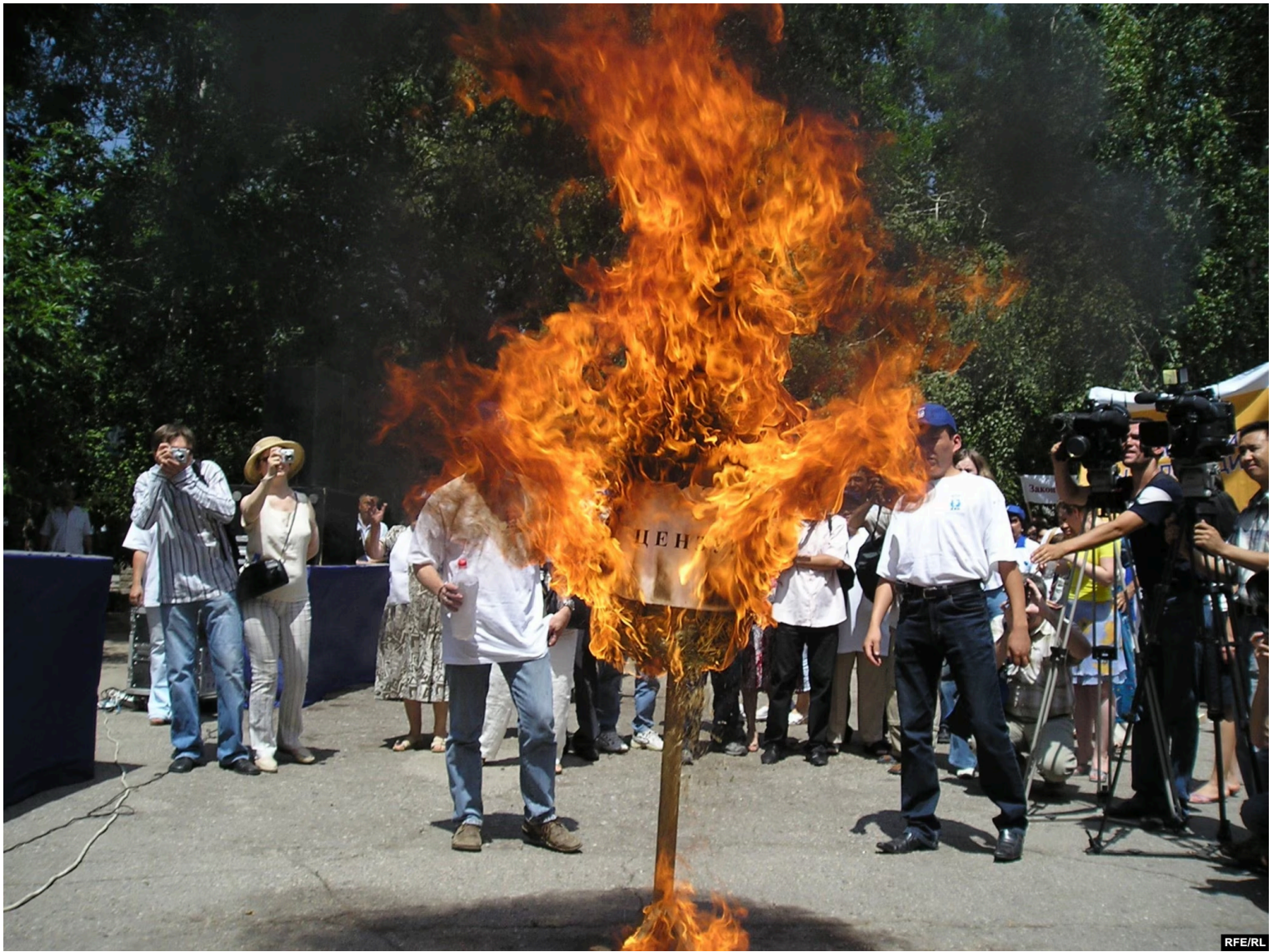
Баспасөз еркіндігін қорғау акциясына қатысушылар цензураны бейнелейтін тұлыпты өртеп жатыр. Алматы, 24 маусым, 2006 жыл

Қазір тіпті ол өзекті емес, себебі одан да күрделі мәселелер бар. Бірақ сол кезде бұл өте өзекті еді. Әр аймақта қордың тілшілері болды, негізінен жұмыс істеп жүрген журналистер еді. Олар ақпарат беруден бас тартқан шенеуніктер туралы мәлімет жинады. "Ең нашар шенеунікке" байқау жарияладық. Он шақты "нашар шенеунікті" анықтап, алма пішінді мүсіндерге тапсырыс бердік, Алматыда болғандықтан.