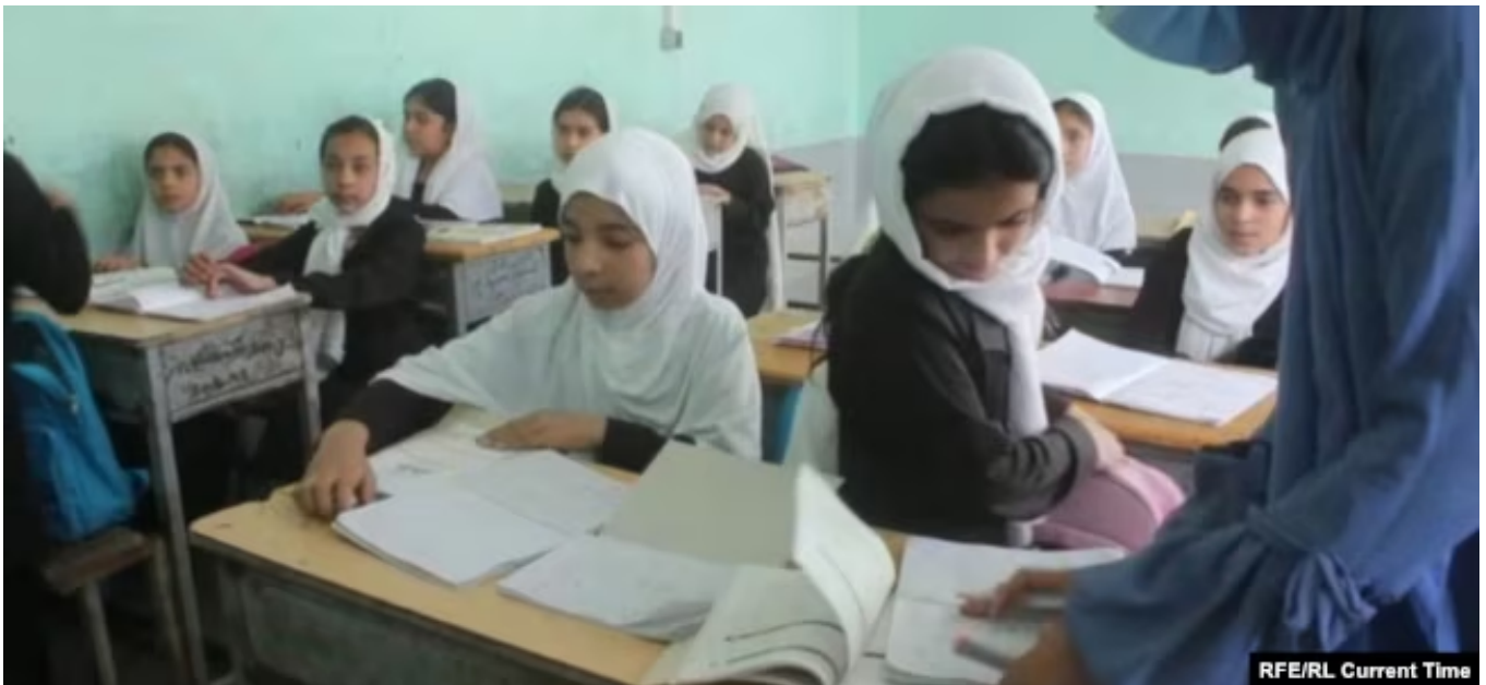
Ауған мектебінде оқып жатқан қыздар. Көрнекі сурет.

8 маусымда БҰҰ-ның арнайы уәкілінің орынбасары және БҰҰ миссиясының Ауғанстандағы жетекшісі Жоржетт Гагон Қауіпсіздік кеңесіне шамамен 7-18 жастағы 3,8 млн ауған қызы мектепке бару мүмкіндігінен айырылғанын айтты.