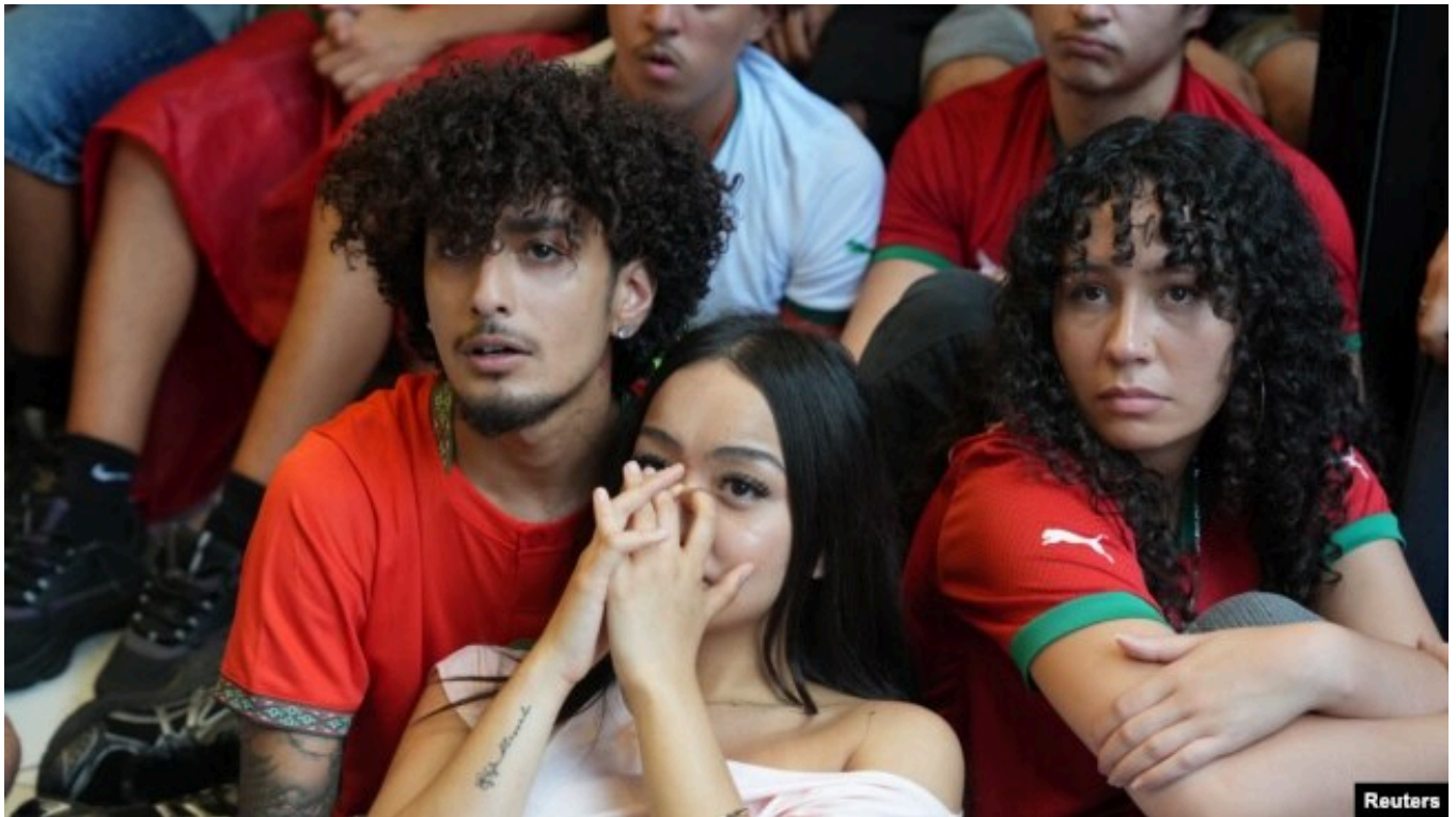
هواداران تیم ملی فوتبال مراکش

با این حال، پیوند مراکش با اروپا بسیار قوی است: ۱۸ نفر از ۲۶ بازیکن این تیم در اروپا متولد شده‌اند. سرمربی آن‌ها، محمد وهبی، نیز بیشتر عمر خود را در بروکسل گذرانده است. در تیم‌های کنگو، الجزایر، کیپ‌ورد و تونس نیز دست‌کم نیمی از بازیکنان در اروپا به دنیا آمده‌اند.