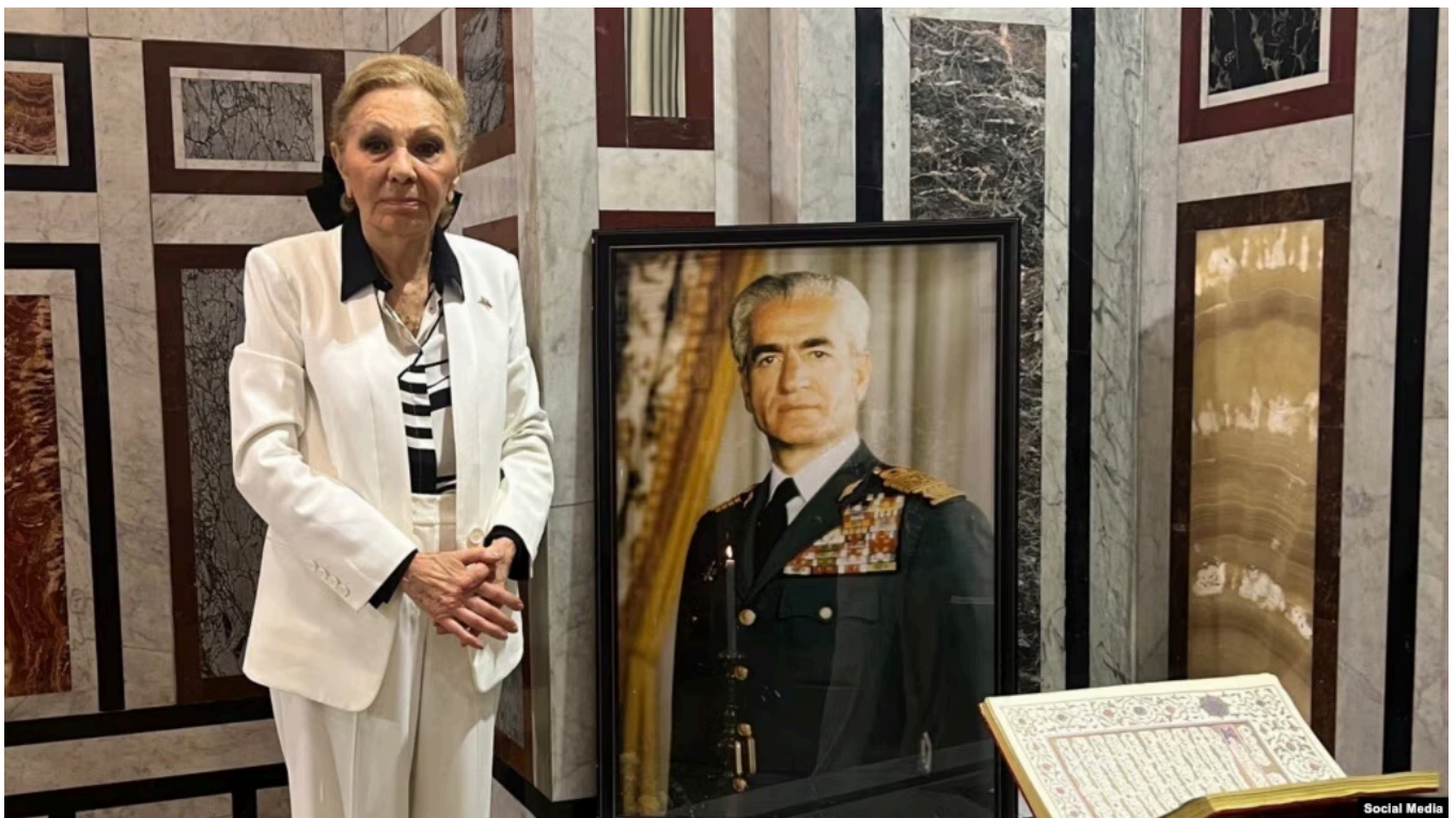
شهبانو فرح بر مزار شاه فقید در قاهره

در پی انتشار اخباری غیررسمی از «لغو» مراسم سالگرد درگذشت آخرین شاه ایران در مصر، شهبانو فرح پهلوی تأیید کرد که مراسم امسال در مردادماه آینده محدود به خانواده پهلوی خواهد بود.