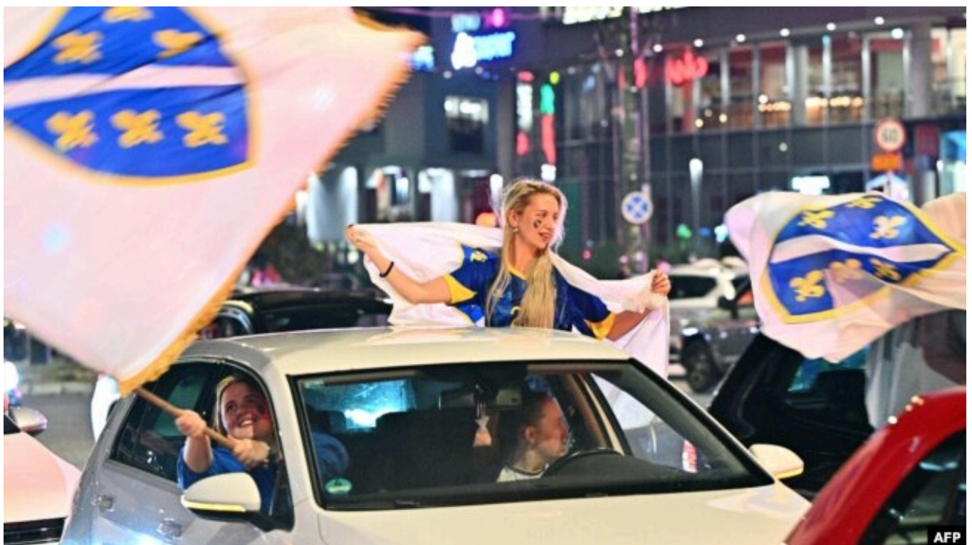
شادی طرفداران بوسنی و هرزگوین از افزایش احتمال صعود تیمشان به مرحله حذفی

قطر، میزبان دوره قبلی جام جهانی و قهرمان آسیا هم در نهایت با تنها یک امتیاز و تفاضل گل منفی ۸ از مسابقات کنار رفت.