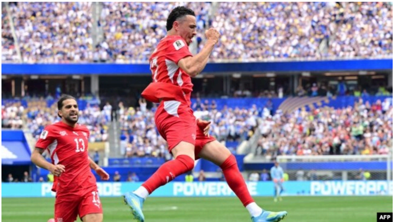
روبن وارگاس گل دوم سوئیس را وارد دروازه کانادا کرد

در دیگر مسابقه این گروه هم بوسنی و هرزگوین ۳ بر ۱ قطر را پشت سر گذاشت و با رساندن امتیازات خود به ۴ در پله سوم جدول ایستاد و با تفاضل گل منهای یک، باید منتظر عملکرد تیم‌های سوم گروه‌های دیگر بماند تا تکلیف صعود یا حذفش روشن شود؛ هرچند با توجه به داشتن ۴ امتیاز، احتمال باقی‌ماندن این تیم در مسابقات بیشتر است.