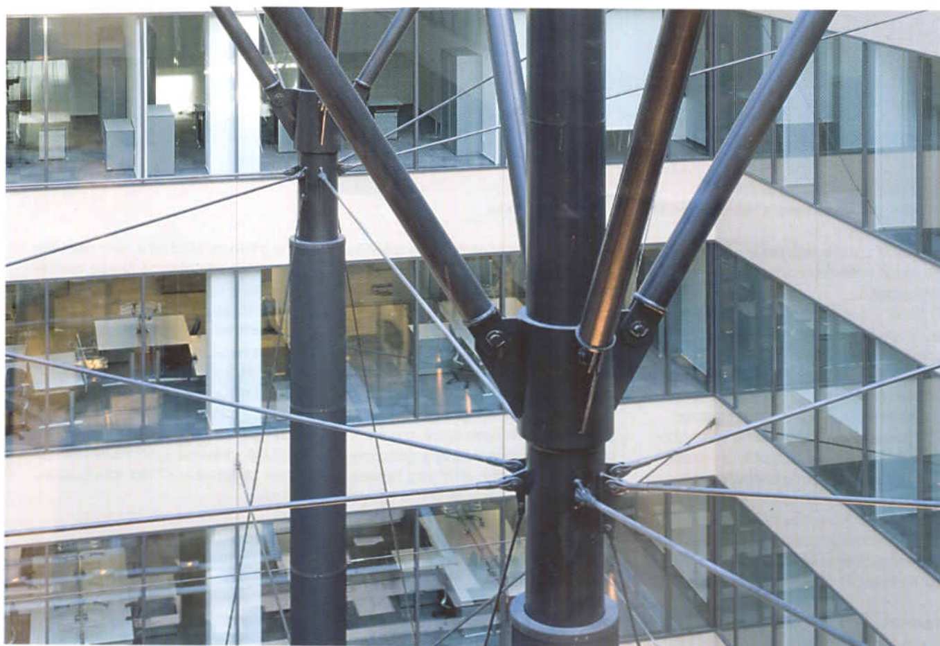
Detail hlavice nosného sloupu