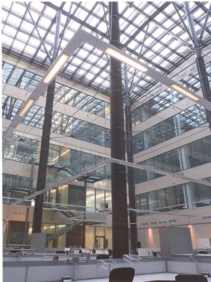
Statika sloupů je dimenzována podobně jako u vládních budov, počítali si ji Američané sami

Obsazenost celé budovy, tj. počet zaměstnanců, je v současné době asi 530. Při ploše 21 900 m 2 tak vychází na jednoho zaměstnance v průměru 41 čtverečních metrů. Samozřejmě nelze vše zjednodušit pouze na přidělené metry, protože budova je přizpůsobena pro eliminaci bezpečnostních rizik a významnou část plochy zabírá technologické a bezpečnostní zázemí. Přesto mohou zaměstnancům „Svobodky“ lidé ze soukromých firem závidět velkorysost prostoru. Budova díky tomu o něco převyšuje parametry administrativních prostor kategorie A, které jsou v současné době v Praze žádané.