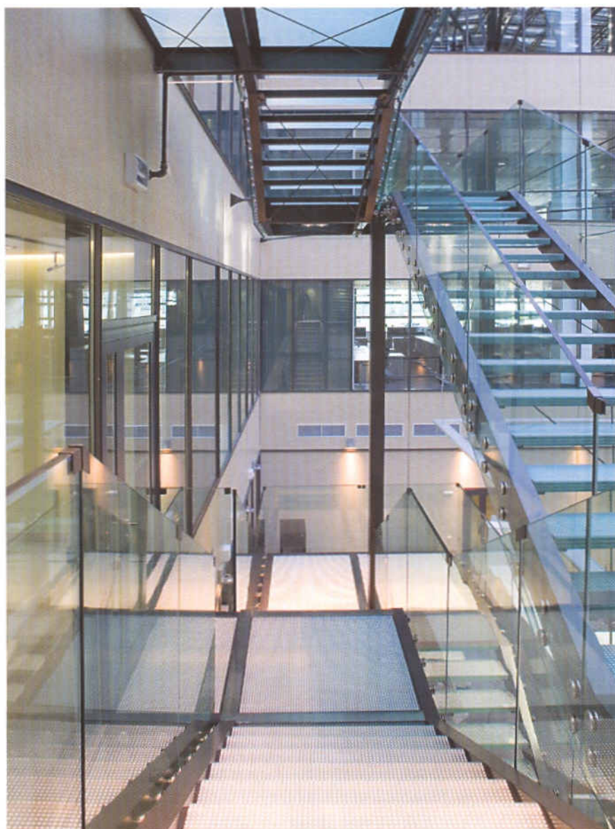
Schodiště – výrazný prvek atria, je kvůli skleněnému zábradlí pro fotografování zřádné

terénu za zadním traktem je výrazně výš, proto byl terén pro novou budovu zčásti vyhlouben.