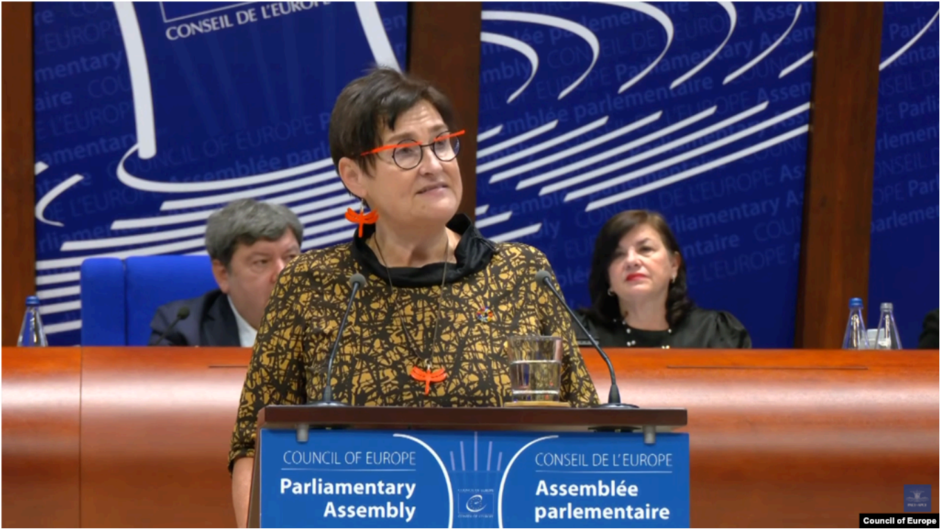
AŞPA prezidenti Petra Bayr

Avropa Şurası Parlament Assambleyasının (AŞPA) prezidenti Petra Bayr ın AzadlıqRadiosuna müsahibəsində Avropa Şurası ilə Azərbaycan arasındakı münasibətlər, insan haqları, Assambleyanın qətnamələri və Azərbaycanın təşkilata qayıdış perspektivləri müzakirə olunub.