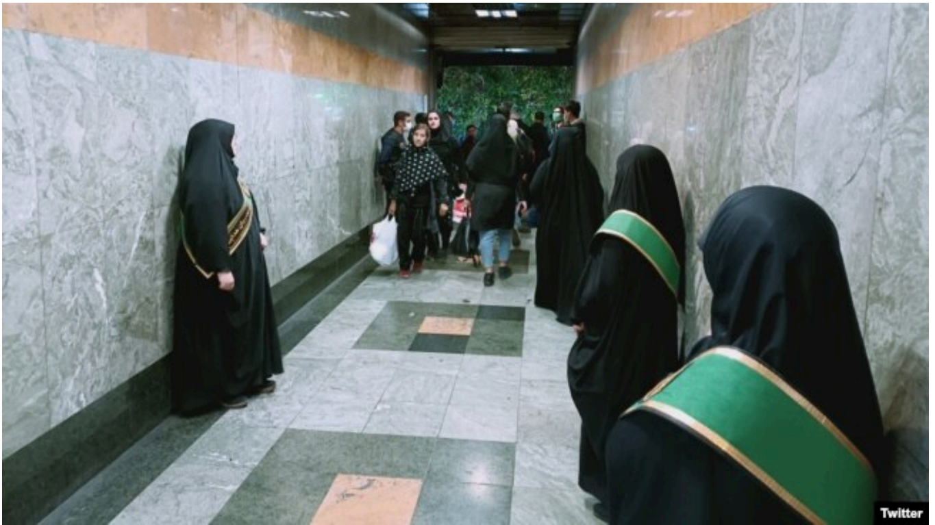
"Əxlaq polisi" Tehran metrosunun stansiyasında insanları izləyir. 2023

Bu dəyişikliklər qadınların illərlə apardığı mübarizənin bəhrəsidir. Həmin müqavimət 2022-ci ildə "Qadın, Həyat, Azadlıq" şüarı altında keçirilən etirazlarla pik həddinə çatdı. Son aylarda isə İrənın ABŞ ilə qarşıdurması və ölkədəki ümumi siyasi gərginlik bu prosesi daha da sürətləndirdi.