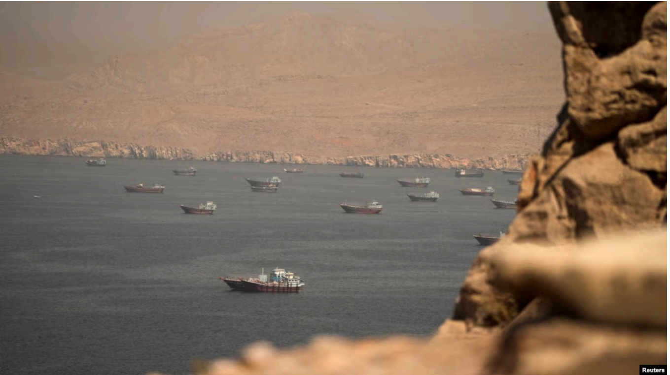
Hörmüz boğazındaki gəmilər

ABŞ-nin İranla çərçivə razılaşması bazarlara dərhal müsbət təsir göstərüb: səhmlər bahalaşıb, neft ucuzlaşıb. Amma bunun uzunmüddətli iqtisadi faydaya çevrilə bilməsi Hörmüz boğazından daşımaların bərpasından asılı olacaq.