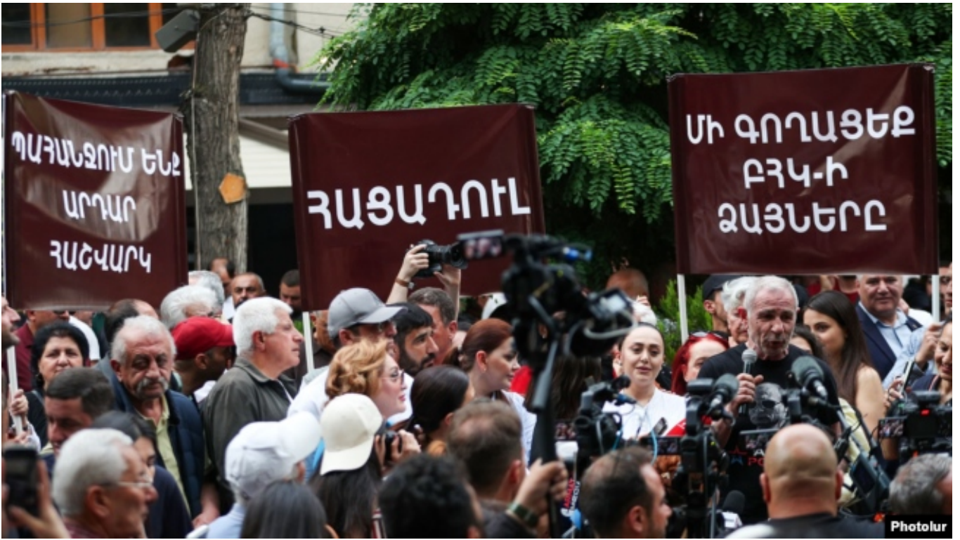
MSK qarşısında etiraz aksiyası