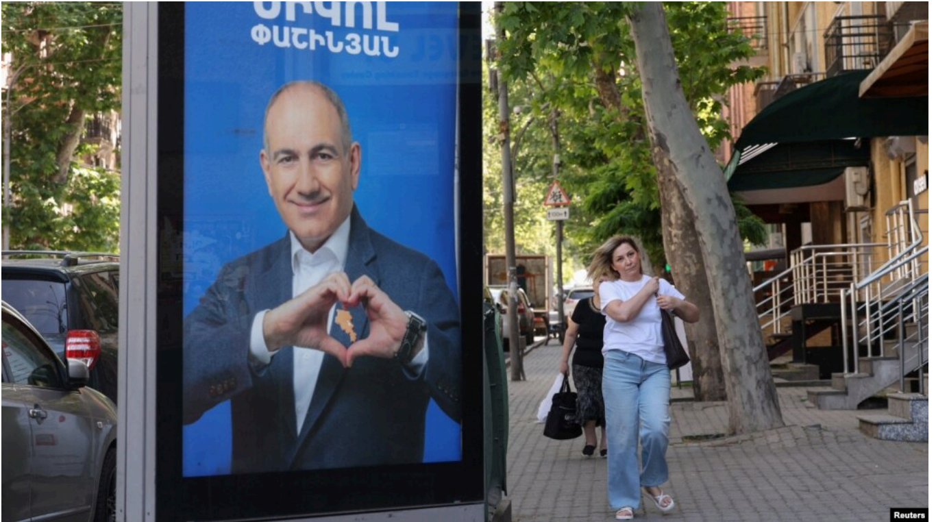
Yerevanda Paşinyanın seçki plakatu

Ermənistanda 7 iyun parlament seçkilərində baş nazir Nikol Paşinyan qələbə qazansa da, qanunverici orqanda üçdə iki səs çoxluğunu əldə edə bilməyib. Qərbi mediası yazır ki, bu nəticə Azərbaycanla sülh sazişinin yekunlaşdırılması üçün tələb olunan konstitusiyaya dəyişikliklərinin həyata keçirilməsini çətinləşdirəcək.