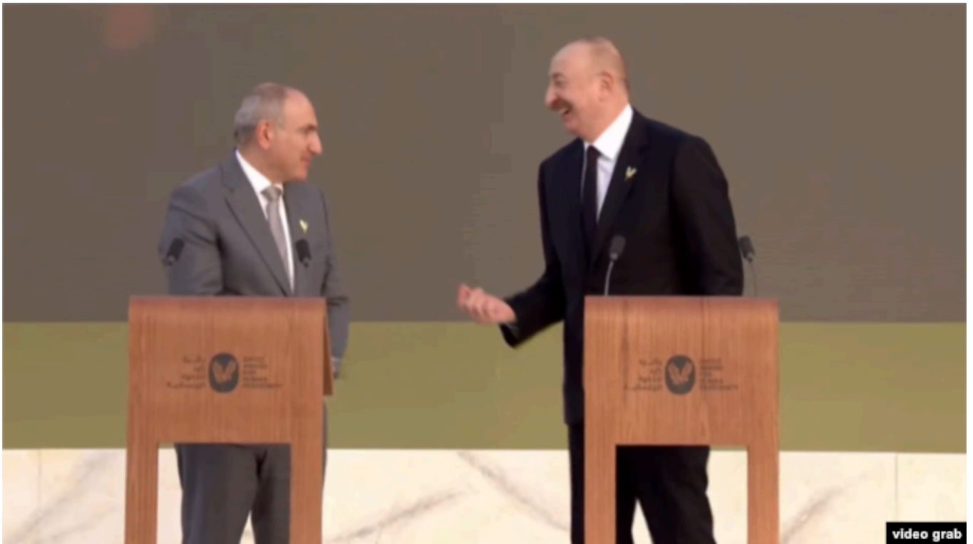
Nikol Paşinyan və İlham Əliyev