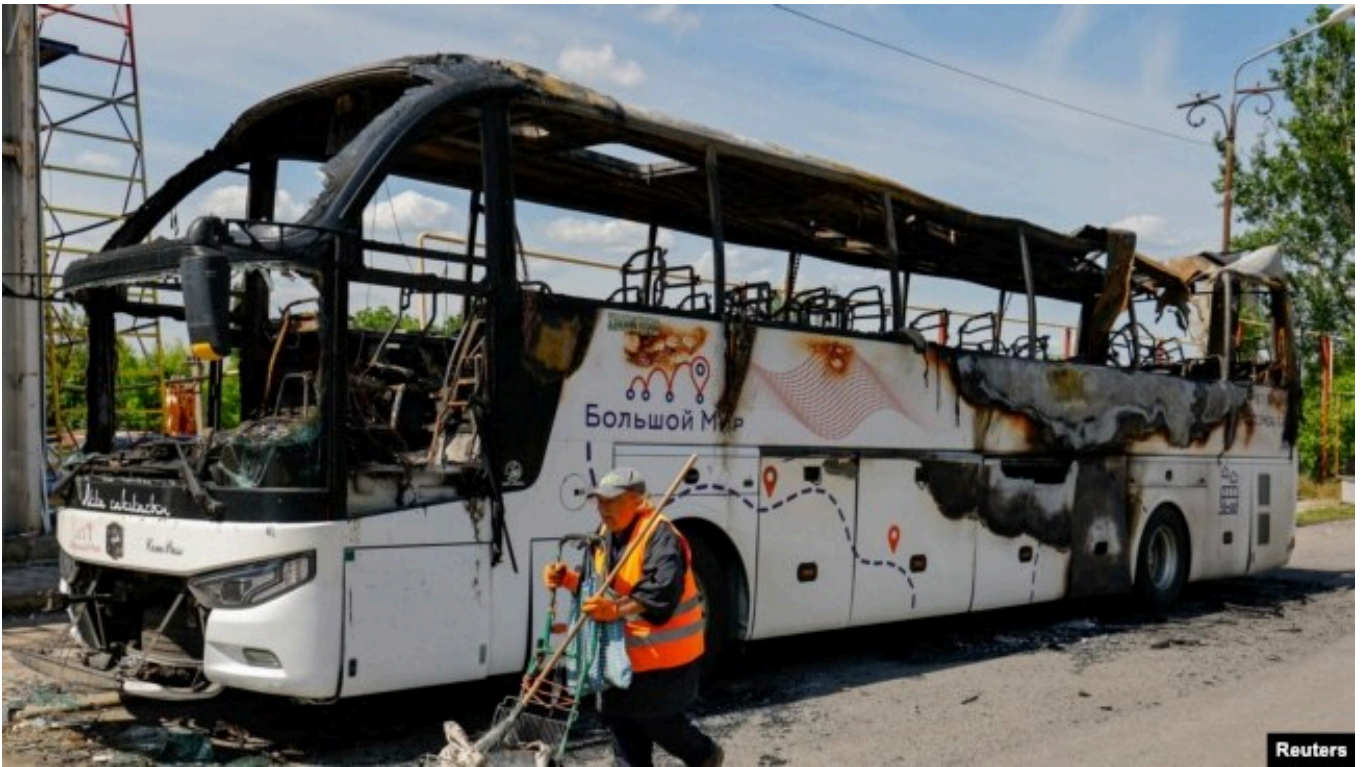
Donetskdə avtobusa dron zərbəsi