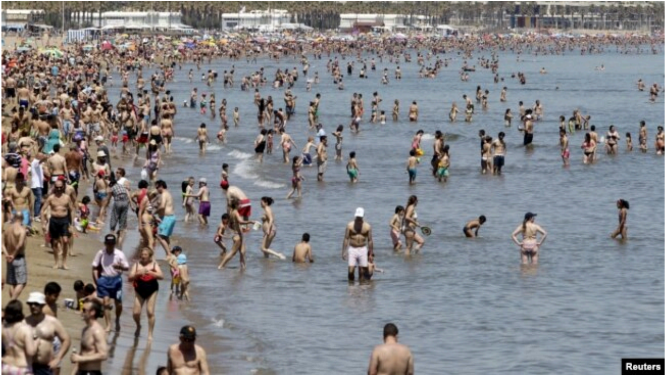
Valensiyada Kabanyal çimərliyi

Bu arada Aİ statistikasına rusiyalıların verilən Şengen turist vizalarının sayında artım olduğunu göstərir. AzadlıqRadiosunun əldə etdiyi məlumatlara görə, 2025-ci ildə rusiyalıların təxminən 480 min Şengen turist vizası verilib. Bu, Moskvanın 2022-ci ildə Ukraynaya qarşı genişmiqyaslı işğala başlamasından bəri ən yüksək göstəricidir.