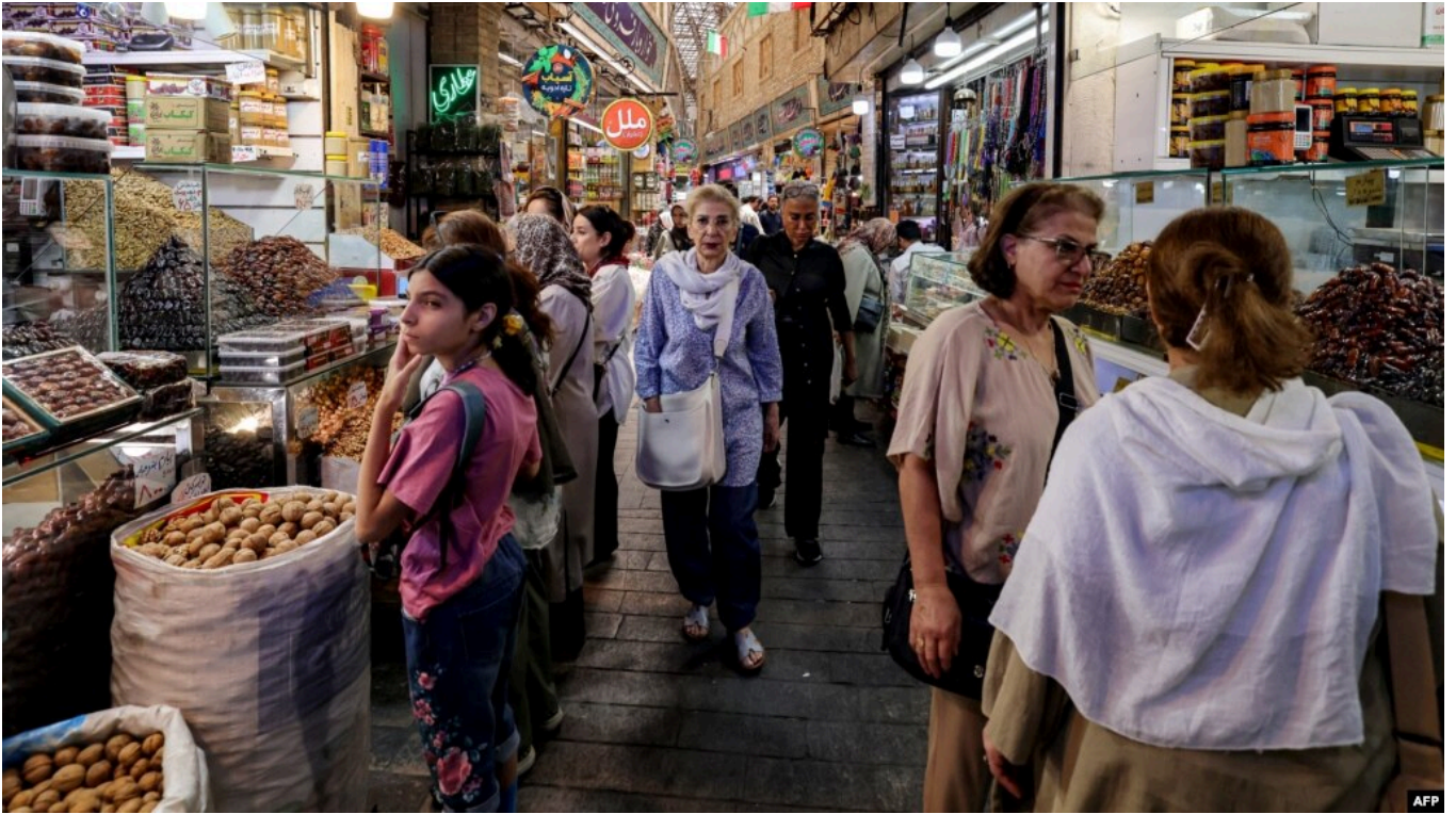
Tehranda Tacriş bazarında insanlar

İranda iqtisadi böhranın dərinləşdiyi bir vaxtda Məsud dolanmaq üçün ev əşyalarını satmağa məcbur qalıb. ABŞ və İsrailin fevralın 28-də başladığı müharibə İranda infrastruktura və sənayeyə böyük zərbə vurub, inflyasiyanı və işsizliyi kəskin artırıb.