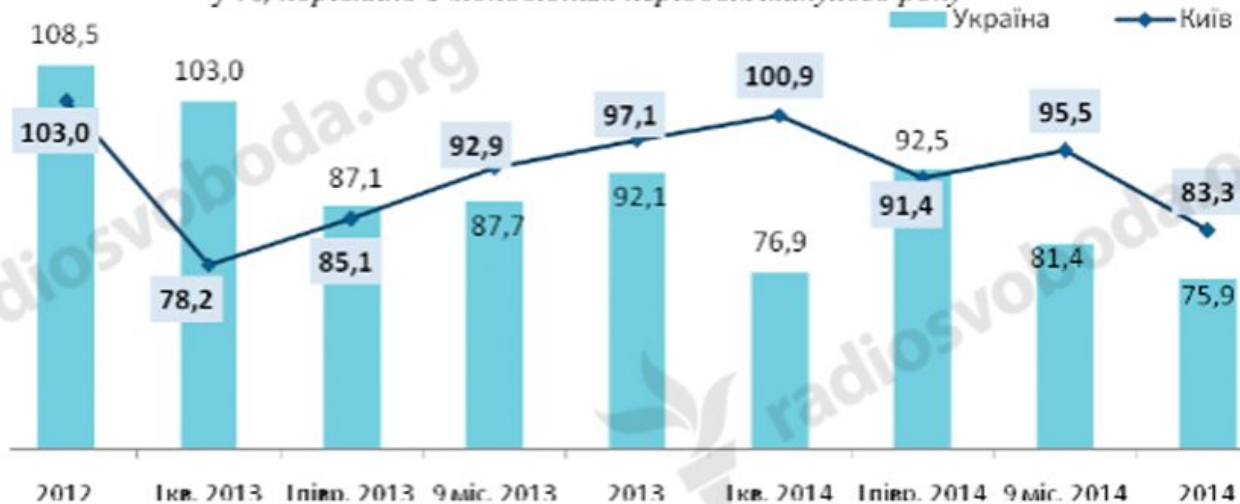
Динаміка темпів зростання (зменшення) капітальних інвестицій по м. Києву, в порівнянні з Україною, протягом 2012 - 2014 рр., у %, порівняно з відповідним періодом минулого року

Основну частку капітальних інвестицій спрямовано в матеріальні активи (91,8% загального обсягу), з яких у будівлі та споруди – 59,7%, у машини, обладнання, інвентар та транспортні засоби – 28,8%. У нематеріальні активи вкладено 8,2% загального обсягу капітальних інвестицій.