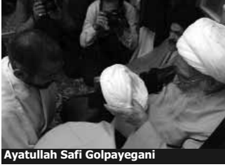
Ayatullah Safi Golpayegani