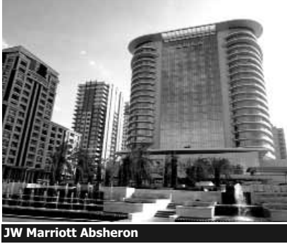
JW Marriott Absheron