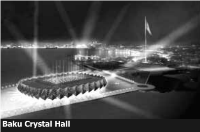
Baku Crystal Hall