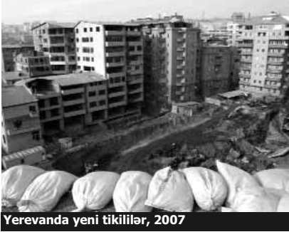
Yerevanda yeni tikililər, 2007

Ermənistan üçün sunamidən başqa bütün təbii fəlakətlər və fövqəladə hallar xarakterikdir. Məsələn, yazda qarın əriməsi və aramsız leysanlar daşqınlara səbəb olur. Xüsusən də bir neçə rayonda güclü külək tikintiyə, kənd təsərrüfatına və insanların səhhətinə ciddi ziyan vurur. Ermənistanın Fövqəladə Hallar Nazirliyinin xilasetmə xidmətinin rəhbəri Ovanesa Khangeldian'ın dediyinə görə, təbii fəlakətlər sırasında sürüşmələrin də miqyası kifayət qədər böyükdür: «Ermənistanstanda sürüşmələr təbii fəlakətlər sırasında xüsusi yer tutur. Bizdə 3000-ə yaxın sürüşmə ərazisi var, onlardan 130-u aktiv zonedir. Bunlar çox böyük təhlükə yaradır, çünki elə aktiv zonalar var ki, orada yaşayış evləri yerləşir».