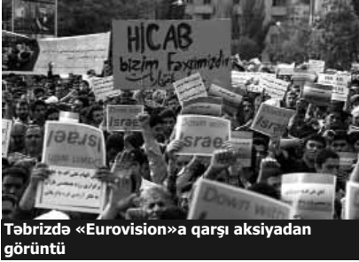
Təbrizdə «Eurovision»a qarşı aksiyadan görüntü

Mayın 8-də İranın Təbriz şəhərindəki Azərbaycan konsulluğu qarşısında «Eurovision»a qarşı mitinq keçirilib. İran mediası yazır ki, «minlərlə insan homoseksualların Bakıya toplaşması»na etirazlarını bildiriblər. Onlar üzərinə «İsrailə ölüm!», «Hicab bizim fəxrimizdir!» yazılmış və Azərbaycan prezidenti İlham Əliyevi «sionist» adlandıran şüarlar da qaldırıblar.