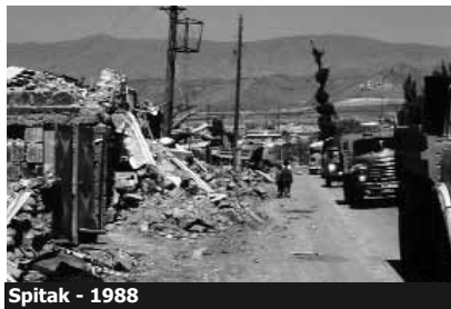
Spitak - 1988