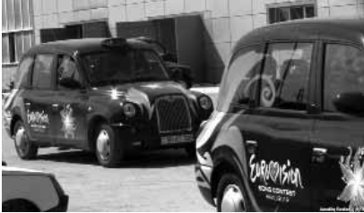
Azərbaycan -- London taxi in Bakı - 02 May 2012

Mayın 10-da AXCP Gənclər Komitəsi «Eurovision 2012» mahnı müsabiqəsi zamanı Azərbaycana gələcək əcnəbi jurnalistlərə, diplomatlara və vətəndaşlara müraciət edib. Müraciətdə bildirilir ki, Azərbaycan hakimiyyətinin müsbət imicini qurmaq məqsədi ilə paytaxtda çalışan taksilərə əcnəbi qonaqları, turistləri getmək istedikləri yerlərə mərkəzi yol və küçələrlə aparmaq, kənar küçə və rayonlardakı yollarla aparmamaq tapşırılıb: «Bu tapşırığın nəticəsində sizlər neft ölkəsi Azərbaycanın paytaxtının mərkəzi rayonundan başqa rayonlarda bərhad yolları, kasıb evləri, vətəndaşların üzləşdiyi çoxsaylı problemləri görməyəcəksiniz. Buna görə də biz AXCP Gənclər Komitəsi olaraq sizlərə müraciət edirik: Bakı təkca abad-