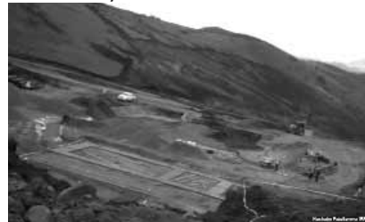
Qızıl emalı zavodunun tikiləcəyi yerdən görüntü

Çovdarda isə yerli sakinlər prezident İlham Əliyevin həmin müəssisənin