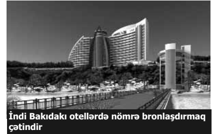
İndi Bakıdakı otellərdə nömrə bronlaşdırmaq çətindir

«Ev sahibləri «Eurovision»u gözləyirlər ki, pul qazansınlar. Həmin mənzillər yüksək səviyyədə olacaq. Ancaq qiymətlər indiki qiymətlərdən artıq olacaq. Ən azı 150-200 manatdan başlayacaq. Bu evlər 2-3-4 otaqlı, təmirli və hər şəraiti olan evlərdir. Qiymətlər sırf o vaxtlar artacaq. «Eurovision» ərəfəsində müraciət edən müştəriləri ayın ortasından gözləyəcəyik. İndiki qiymətlərlə həmin vaxtkı qiymətlər arasında 2-3 dəfə artım olacaq».