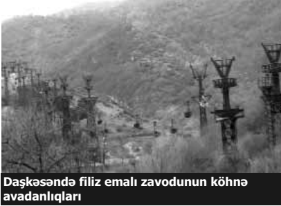
Daşkəsəndə filiz emalı zavodunun köhnə avadanlıqları