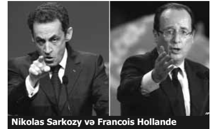
Nikolas Sarkozi və Francois Hollande

Seçkinin nəticələrini AzadliqRadiosu.az saytında oxuyun.