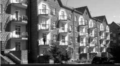
Turistlər təkcə otellərdə yox, gündəlik kirayə evlərdə də qalır