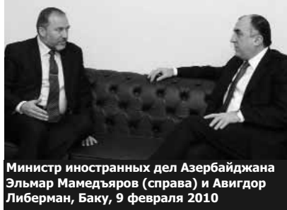
Министр иностранных дел Азербайджана Эльмар Мамедъяров (справа) и Авигдор Либерман, Баку, 9 февраля 2010

- Хотел бы отметить, что в регионе у нас происходят очень тревожные события, которые заключаются в том, что Иран, с одной стороны, сближается с союзником России – Арменией, при этом являясь союзником России. Иран резко возражает против сближения Азербайджана с Израилем. В Азербайджане был министр иностранных дел Авигдор Либерман. Состоялись важные переговоры, во время которых обсуждался и вопрос об Иране, который тревожит Израиль, и в то же время тревожит Азербайджан. Я считаю, что треугольник – это союз России, Ирана и Армении, которая фактически находится в составе России. Поэтому Иран оказывает Армении огромную помощь - и горючим, и газом, и различного рода экономиче-