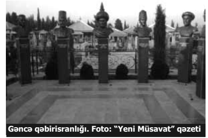
Gəncə qəbiristanlığı.