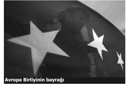
Avropa Birliyinin bayrağı

«Azərbaycanda hələ çox ciddi dəyişikliklərə ehtiyac var, xüsusilə də ədalət sistemi, korrupsiya, mütəşəkkil cinayətkarlıqla mübarizə və əlbəttə ki, insan hüquqları ilə bağlı beynəlxalq normaların tətbiqi sahəsində. Dövlət gəlirlərinin xərclənməsi və yuxarı eşelonlardakı korrupsiya hallarının araşdırılması da vacibdir və bu, hakimlər və siyasətçilər üçün əsl