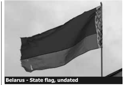
Belarus - State flag, undated