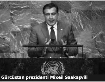
Gürcüstan prezidenti Mixeil Saakaşvili