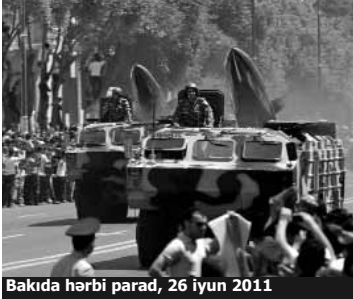
Bakıda hərbi parad, 26 iyun 2011

Ötən il dünyada hərbi büdcəsini ən çox artıran ölkə Azərbaycan olub – 89 faiz. Stokholm Beynəlxalq Sülh Araşdırmaları İnstitutu dünya ölkələrinin hərbi büdcələri ilə bağlı illik hesabatını açıqlayıb. İnstitut hesabatında qeyd edir ki, Azərbaycanın hərbi büdcəsindəki bu böyük artım "Qarabağ müharibəsinin yenidən başlanması qorxusunu artırır".