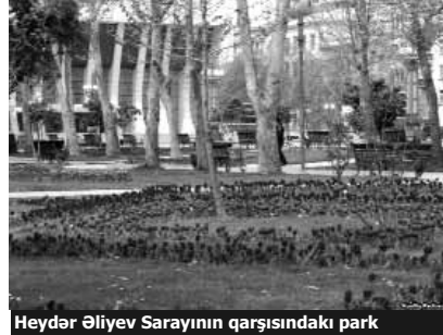
Heydər Əliyev Sarayının qarşısındakı park

Aprelin 20-dən Gül bayramı ilə bağlı hazırlıqlara başlanılıb. Artıq Heydər Əliyev Sarayının qarşısındakı parka bununla bağlı avadanlıqlar gətirilib.