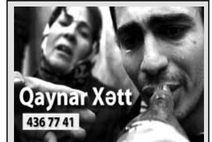
Qaynar Xətt 436 77 41