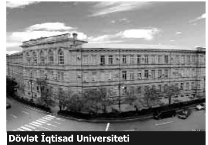
Dövlət İqtisad Universiteti

- Əlbəttə, bizim universitetdə Boloniya sistemidir, test üsuludur. İmtahan vermək üçün hər şərait yaradılır, amma kollokviumun bu üsulla verilməsi xoşumuza gəlmədi. Əslində kollokviumların belə keçirilməsi yaxşıdır. Çünki müəllim-tələbə arasında rüsvət münasibətlərinə son qoyur. Rektorun bu qərarı göstərir ki, müəllimlər qiymətimizə təsir edə bilməyəcək, hər kəs biliyinə uyğun qiymət ala biləcək. Bunu dəstəkləyirik, sadəcə, metodu vermək