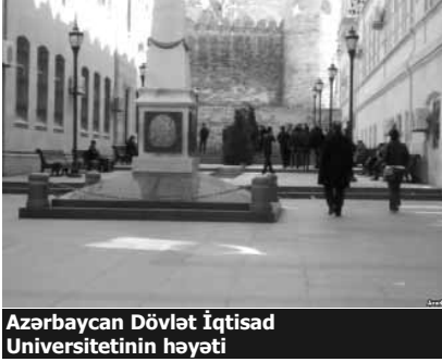
Azərbaycan Dövlət İqtisad Universitetinin həyəti

Martın 29-da İqtisad Universitetində tələbələr kollokviumu (imtahanqabağı tələbələrin biliyinin öyrənilməsi prosesi) boykot ediblər. 100-dən artıq tələbə tətbiq edilən yeni sistemə etiraz edib. Bu barədə AzadlıqRadiosuna etirazçı tələbələr məlumat veriblər. «Boloniya sisteminə görə, hər ay biz imtahanqabağı 7 fənnin hərəsindən 5 sual olmaqla 35 suala 3 saat ərzində cavab verməliyik. Bu da fiziki cəhətdən mümkün olmayan