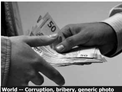
World -- Corruption, bribery, generic photo