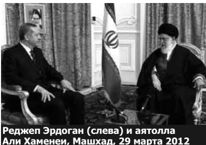
Реджеп Эрдоган (слева) и аятолла Али Хаменеи, Машхад, 29 марта 2012

придерживаются совершенно разных позиций по сирийскому конфликту. В ходе завершившегося визита в Тегеран премьер-министр Турции Реджеп Эрдоган заявил, что режиму сирийского президента Ба-