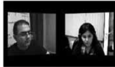
AzadliqFM arxiv Quba toqquşmalarının Facebook mənzərəsi