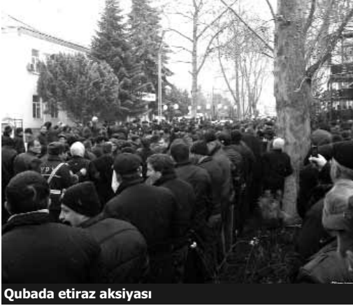
Qubada etiraz aksiyası