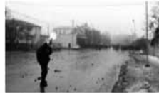
Qubada 1 mart toqquşması