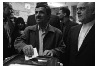
Mahmud Əhmədinejad seçkiləri udur