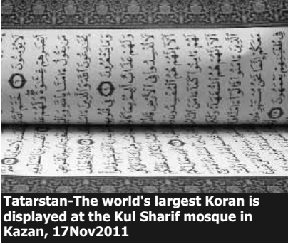
Tatarstan-The world's largest Koran is displayed at the Kul Sharif mosque in Kazan, 17Nov2011

Dubay hökuməti başçısının müavini, BƏƏ-nin maliyyə naziri Şeyx Hamdan bin Rashed Al Mak-