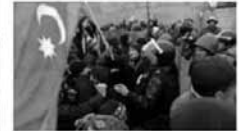
Multimedia Qubada etiraz aksiyası keçirilib - Yeni Fotolar