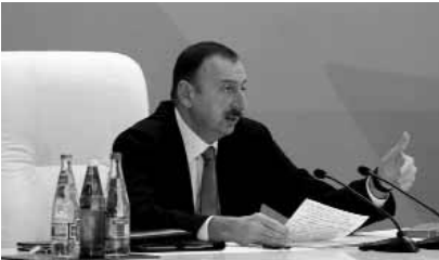
Ильхам Алиев, Баку, 28 февраля 2012

"В 2013-2023 годах Азербайджан должен превратиться в страну с высокими доходами населения", - такую задачу перед правительством страны поставил президент Азербайджана Ильхам Алиев. Он высказал эту мысль 28 февраля на заседании по итогам реализации «Госпрограммы социально-экономического