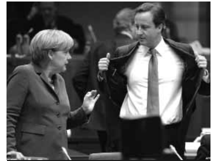
Müqavilənin sponsoru Almaniya kansleri Merkel və imza atmaqdan imtina edən Britaniya baş naziri Kameron

Müqavilənin məzisi avrozonaya daxil olan 17 ölkənin böyük borclara girməsinin qabağını almaqdır. İndi növbəti problem müqavilənin hər bir ölkədə ratifikasiyasıdır. İrlandiya kimi ölkələrdə bunun çətinliklə başa gələcəyi gözlənilir. Müqavilə indi imza atan 25