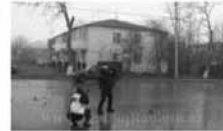
Azərbaycanda (VIDEO) Quba qarşudürməsi - 3 ən dramatik məqamlar