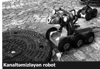
Kanal təmizləyən robot

– Azərbaycanda bəzi binaların zirzəmiləri suyla doludur. Bəzilərinə təmizlədik. MUM-un önündə xətt bağlı idi, açdıq, öz yoluna bağladıq, Hövsana yönəldik. Mən təklif etdim ki, kanalları təmizləmək üçün robotları gətirim, sizin