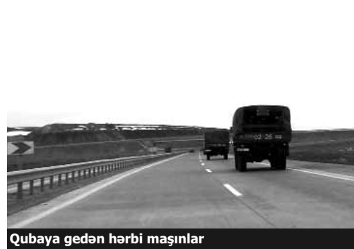
Qubaya gedən hərbi maşınlar

AzadlıqRadiosunun əməkdaşları bildirirlər ki, 2 «Qaz-66» markalı avtomobildə Daxili Qoşunların əsgərləri və 1 maşında Çevik Polis Alayının qüvvələrini müşahidə ediblər.