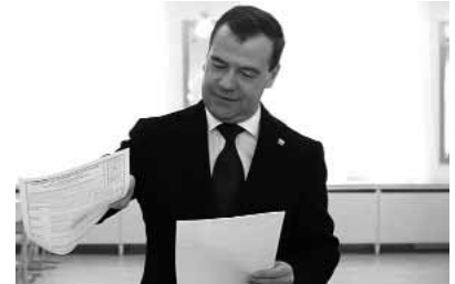
Rusiyada prezident seçkiləri qanunsuzluqlarla keçib