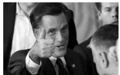
Respublikaçı Mitt Romney Vaşinqtonda qalib gəlib