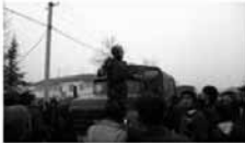
Multimedia Qubada 1 mart toqquşması