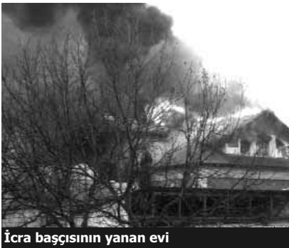
İcra başçısının yanan evi

İcra hakimiyyəti qarşısına yığışanlar icra başçısının istefasını tələb ediblər. Ağsaqqal sayılan 3 nəfər rayon sakini icra başçısının qəbuluna girib. Onlar tələb edirdilər ki, icra başçısı aksiyaçıların qarşısına çıxıb sakinlərdən üzr istəsin və istefa versin.