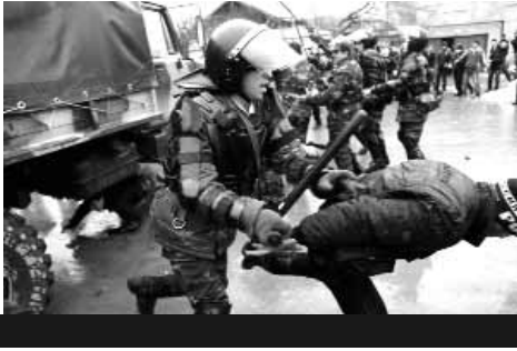
(əvvəli səhifə 2-də)