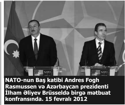
NATO-nun Baş katibi Andres Fogh Rasmussen və Azərbaycan prezidenti İlham Əliyev Brüsseldə birgə mətbuat konfransında. 15 fevralı 2012