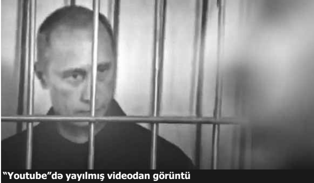
"Youtube"də yayılmış videodan görüntü

Kimsə öz arzusunu həyata keçirməyin yaradıcı yolunu tapıb. Arzu - Rusiya baş naziri Vladimir Putini müttəhimlər kürsüsündə görmək. Bu günlərdə «YouTube»da yelədirilən «Vladimir Putinin həbsi: Məhkəmə zalından reportaj» adlı video kosmik sürətlə sosial şəbəkələrdə və dünya mediasında yayılıb. 50 saniyəlik videoyaya artıq 3 milyondan çox adam baxıb, altında 20 mindən çox şərh yazılıb.