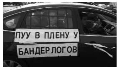
Rusiya müxalifəti «Ağ küçələr» adlı avtoyürüş keçirir