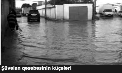
Şüvəlan qəsəbəsinin küçələri