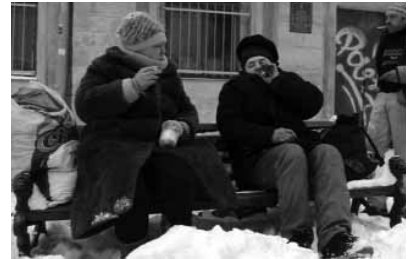
Ermənistanda evsizlərin sayı durmadan artır