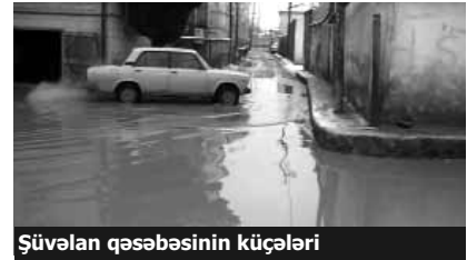
Şüvəlan qəsəbəsinin küçələri

O, həmçinin «Azərsu»-nun indiki rəhbərliyinin daha çox iş görmək, texnologiya almaq istədiyini, Türkiyədən məsləhətçi kadrlar da dəvət etdiyini qeyd edir. Yerli iqtisadçılar da problemin həllini, Azərbaycanda da bir çox xarici ölkələrdə olduğu kimi, kommunal sahənin özəl şirkətlərin idarəsinə verilməsində görürlər.