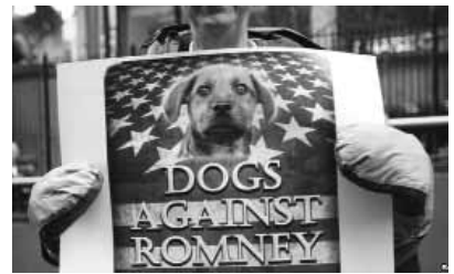
«İtlər Romney'ə qarşı»