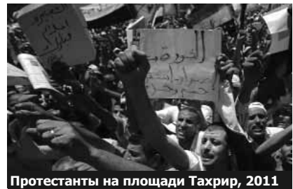
Протестанты на площади Тахрир, 2011

В отличие от Египта, в Азербайджане нет никакого уважения к собственности, что тоже понятно в постсоветской стране, где практически любая значительная собственность, кроме жилья, была уворована у государства. Люди это знают и коррупционные «уводы» собственности никого особо не волнуют, кроме потерпевших.