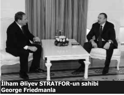
İlham Əliyev STRATFOR-un sahibi George Friedmanla

2012-ci ildə Rusiyanın Cənubi Qafqazda hansı fəallığı gözlənilir və buna Ermənistan, Gürcüstan və Azərbaycan necə cavab verəcək? Stratforun yeni araşdırması bu barədədir.