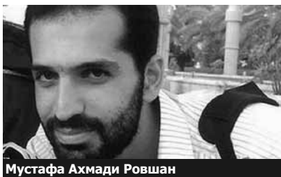
Мустафа Ахмади Ровшан

Власти Ирана обвинили Азербайджан в причастности к убийству иранского ученого-ядерщика Мустафы Ахмади Ровшана. Сообщается, что в воскресенье посол Азербайджана в Иране Джаваншир Ахундов был вызван в министерство иностранных дел Ирана, где ему были высказаны обвинения в том, что "Баку оказал содействие израильским спецслужбам в организации убийства ученого".