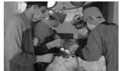
Həbsdə olan cərrah: «Mən pulu rüşvət yox, hörmət kimi qəbul etmişəm»