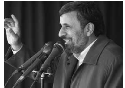
Əhmədinejad: «Yaxın günlərdə nüvə layihəsi təqdim olunacaq»