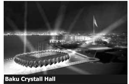
Baku Crystal Hall

üçün bilet göstərmək lazım olacaq. Bu üç sənəddən biri Bakı hava limanında viza almağa bəs edəcək. Bu barədə prezident İlham Əliyev fevralın 10-da fərman imzalayıb. Sənəddə sadələşdirilmiş qaydada viza almaq istəyən xaricilər üçün müddətlər də nəzərdə tutulur: “Eurovision-2012” mahnı müsabiqəsinə gələnlər 2012-ci il aprelin 15-dən iyunun 1-dək belə viza üçün müraciət edə bilərlər.