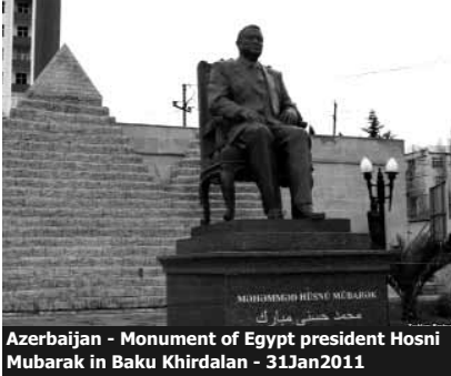
Azerbaijan - Monument of Egypt president Hosni Mubarak in Baku Khirdalan - 31Jan2011

4 milyardlıq qanunsuz varidatın izlərini tapan jurnalist araşdırması