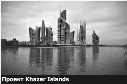
Проект Khazar Islands

«Строительство города на Каспийском море - Khazar Islands обойдется в 100 млрд. долларов». Это сообщил президент концерна Avesta, который ведет строительство, Гаджи Ибрагим Нехрямли. Khazar Islands, который строится на искусственном архипелаге, будет состоять из 41 острова различных размеров общей площадью 3 000 гектаров и 19 микрорайонов. В общей сложности архипелаг займет 24 кв. км – длина составит 8 км, ширина - 3 км. Общая длина бульвара достигнет 50 км.