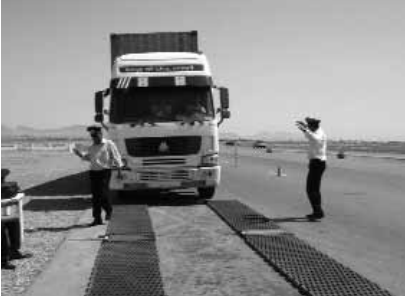
Arxiv foto. Nəqliyyat Nazirliyinin işçiləri İrandan gələn iri yük maşınlarını Azərbaycan ərazisində tərəziyə çıxarırlar. 2 iyun 2010

Sahibkar Ədalət Abbasovun AzadlıqRadiosuna dediyinə görə, ötən 18 gün ərzində o, Sumqayıt Baş Gömrük İdarəsi ilə Dövlət Gömrük Komitəsinə dəfələrlə müraciət edib. Yükün buraxılması səbəblərinə aydınlıq gətirilməsini istəyib.