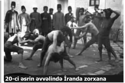
20-ci əsrin əvvəlində İranda zorxana