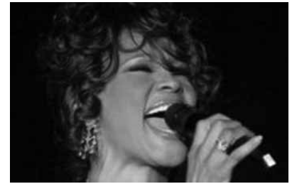
Müğənni Whitney Houston vəfat edib