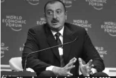
İlham Əliyev İsveçdə konfransda, 29.01.2009

Əsasında populyar film çəkilmis bir məşhur komediya əsəri var – Catch-22. Əsərin qəhrəmanı Amerika hərbi təyyarəçisi John Yossariandır. 1943-cü ildə İtaliyada yerləşmiş eskadriliyada xidmət edir. Əsərə görə Yossarian qəribə bir psixoloji problem yaşayır. Ona elə gəlir ki, hamı onu öldürmək istəyir. Sübut üçün də uzağa getmir: "Mənə atəş açırlar!" – deyir. Ona bildirirlər ki, müharibədir, sən də alman təyyarələri ilə döyüşə girən bir Amerika təyyarəçisən. "Bəs onda niyə mənə atəş açırlar?" – soruşur. Yenə ona deyirlər, çünki alman hərbiçiləri bütün amerikalılara atəş açırlar.