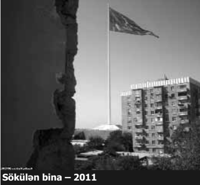
Sökülən bina – 2011