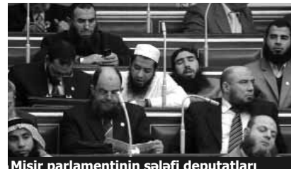
Misir parlamentinin sələfi deputatları

Aparıcı onu da deyib ki, indi Misirdə hansı avtomobili seçib-seçməməkdən də vacib, həll olunması lazım olan problemlər var.