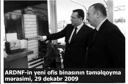
ARDNF-in yeni ofis binasının təmələqoyma mərasimi, 29 dekabr 2009