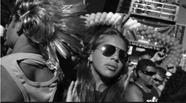
Homoseksualların hər il Braziliyada keçirdiyi iftixar yürüşü. San Paulo, 6 iyun 2010

Homoseksuallara aid nighttours.com saytı 2012-ci ildə dünya ölkələrində bu cür cinsi azlıqların kütləvi toplaşacağı tədbirlərin təqvimini dərc edib. Həmin tədbirlərə həm homoseksualların dünya boyu keçirdiyi iftixar yürüşləri, həm də onların kütləvi şəkildə iştirak etdiyi qapalı tədbirlər aiddir. Bunların çoxunu homoseksuallar özləri təşkil edir, amma bəziləri homoseksuallarla bağlı olmasa da, onlar həmin tədbirlərə adi iştirakçılar kimi qatılmağı xoşlayırlar.