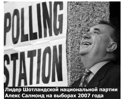
Лидер Шотландской национальной партии Алекс Салмонд на выборах 2007 года

Однако в случае обретения независимости у Шотландии могут возникнуть серьезные проблемы. Став еще одной маленькой страной Европы (ведь в Шотландии проживают чуть более пяти миллионов человек) и стремясь при этом сохранить нынешние бесплатные здравоохране-