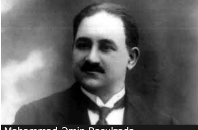
Məhəmməd Əmin Rəsulzadə