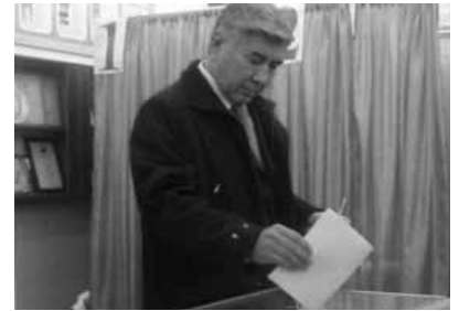
Qazaxıstanda parlament seçkisində pozuntular olduğu bildirilir