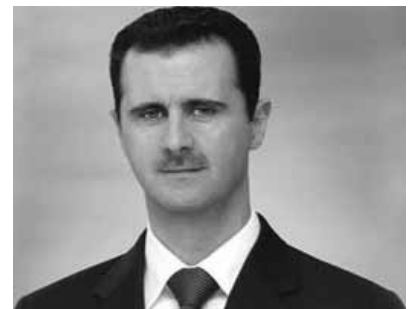
Bəşər Əsəd hamıya amnistiya elan edib