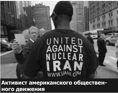
Активист американского общественного движения

Аналитическую статью на эту тему газета The Times начинает со слов израильского начальника Генштаба армии обороны Израиля Бени Генца о том, что этот год будет для Ирана переломным. Газета предполагает, что говоря это, Генц имел в виду череду последних новостей, связанных с Ираном: гибель иранских физиков, появление разведывательного беспилотного самолета США сбитого Ираном, учения в Пер-