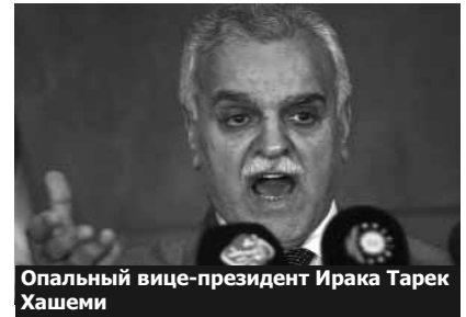
Опальный вице-президент Ирака Тарек Хашеми

ности своего заместителя, суннита Салеха Муталака. 21 декабря Малики потребовал от курдов выдать Хашеми и предупредил бойкотирующих парламент законодателей-суннитов о том, что они рискуют оказаться за пределами властных структур. Согласно американским дипломатическим источникам, обвинения в адрес вице-президента, скорее всего, политически мотивированы. Разрядить кризис не помогло экстренное телефонное вмешательство вице-президента США Байдена, призвавшего премьера Малики и спикера парламента провести экстренные переговоры со всеми иракскими лидерами. 21 декабря уважаемая газета Christian Science Monitor первой из ве-