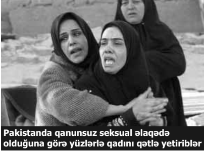
Pakistanda qanunsuz seksual əlaqədə olduğuna görə yüzlərlə qadını qətlə yetiriblər

Bu ilin 10 ayında Pakistanda 675 qadın namus üstündə öldürülüb. Yerli hüquq müdafiəçiləri deyirlər ki, rəsmi rəqəmlər azalsa da, realıqda bu cür cinayətlərin sayı ildən-ilə artır. Belə ki, 2010-cu ildə 791 qadın, 2009-da isə 600 qadın kişilər tərəfindən öldürülüb. Bu haqda Pakistanın İnsan Haqları üzrə Komissiyası məlumat açıqlayıb. AzadlıqRadiosunun məlumatına görə, bu yaxınlarda Pakistanda namus üstündə qətlərin qarşısının alınmasına yönələn yeni hüquqi qayda qəbul edilib. Bu sənəd həmçinin KİV-in də bu hadisələr haqqında daha açıq yazmağa icazə verir. Amma vətəndaş cəmiyyəti üzvləri hesab edir ki, hələ bu sahədə görüləsi iş çoxdur.