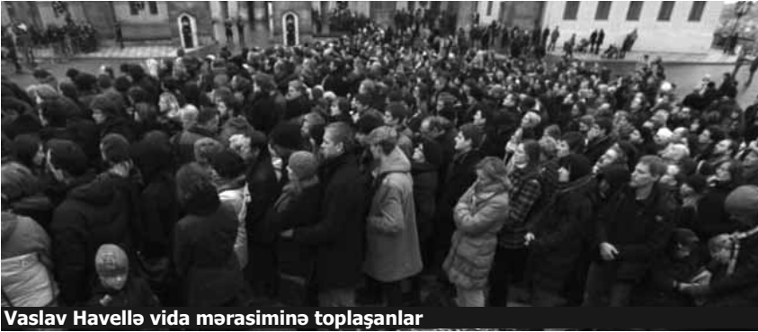
Vaslav Havelə vida mərasiminə toplaşanlar

- Uzun illər təqib edilən və qəfildən prezident olan dissidentlərin dünyanı bir anda dəyişəcəklərini gözləmək, böyük səhvdir. Totalitar rejimdə şər ilə üzleşən bizlər, şərə biganəliyin ilk əlamətlərinin təhlükəsini dərhal hiss etməli idik. Hərdən öz-özümə deyirəm ki,