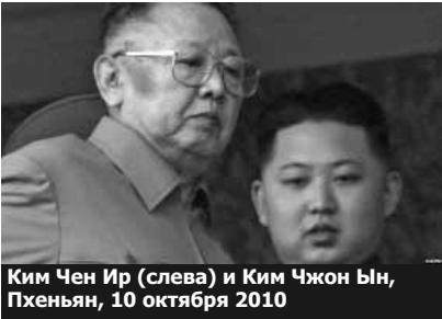
Ким Чен Ир (слева) и Ким Чжон Ын, Пхеньян, 10 октября 2010

Лидер Северной Кореи Ким Чен Ир умер, порулив страной 17 лет. Незадолго до смерти он произвел младшего сына Ким Чжон Ына, - которому нет и тридцати, - в генералы, ввел в состав ЦК правящей партии, а также сделал зампредом Центрального военного комитета партии. Информационное агентство КНДР уже призвало народ объединиться вокруг молодого Ким Чжон Ына, а СМИ называли его «Великим преемником».