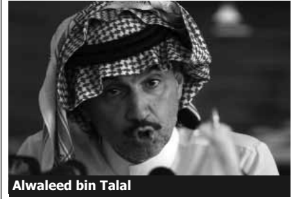
Alwaleed bin Talal

Burada "Delta" şirkətinin nəzarətçisi bir daha onların baqajını və özlərini yoxlayıb. İmamlardan üzr istəyərək onları təyyarəyə göndəriblər. Lakin pilot onları içəri buraxmayıb. "Delta" nəzarətçisi ona başa salmağa çalışıb ki, ağlabatan səbəb olmadan sərnəşinləri reysə buraxmamaq olmaz. Amma danışıqlar nəticə verməyib. Pilot deyib ki, sərnəşinlər bu insanların təyyarədə olmasına narahatlıq keçirir. Halbuki "Delta"-nın meneceri sərnəşinlər arasında kiminsə narahat olub-olmadığını soruşub. Lakin pilotdan başqa heç kim narazılığını bildirməyib. Nəhayət, təyyarə imamlar olmadan uçub.