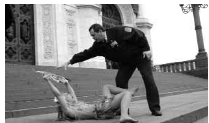
В Москве у Храма Христа Спасителя движение FEMEN провело акцию "Боже, царя гони!"