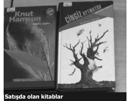
Satışda olan kitablar