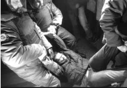
Задержание одного из участников протеста на Триумфальной площади 6 декабря

The Guardian назвала протестные выступления в Москве "крупнейшими за последние годы". При этом газета пишет, что российские демонстрации вряд ли способны превратиться в силу, сравнимую с той, что родилась на египетской площади Тахрир – даже несмотря на то, что события в Каире и Москве, по мнению западных наблюдателей, очень схожи.