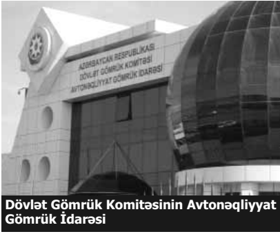
Dövlət Gömrük Komitəsinin Avtonəqliyyat Gömrük İdarəsi