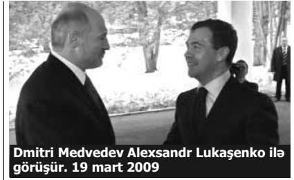
Dmitri Medvedev Aleksandr Lukaşenko ilə görüşür. 19 mart 2009