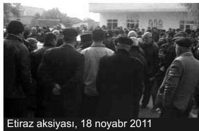
Etiraz aksiyası, 18 noyabr 2011

əhalinin qaz ehtiyacları hasilat quyularından verilən səmt qazı hesabına ödənilirdi. Bir ilə yaxındır əhaliyə qaz verilməsi dayandırılıb. Halbuki kənddə yaşayan vəziyyəti və imkanlı adamların evlərinə, sahibkarların obyektlərinə ordan yenə də qaz ötürülür.