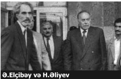
Ə. Elçibəy və H. Əliyev