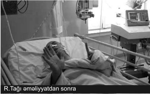
R. Tağı əməliyyatdan sonra

Naməlum adam ona 6 bıçaq zərbəsi vuraraq qaçıb