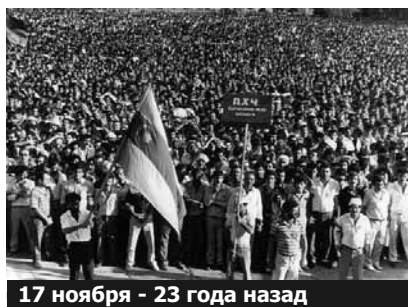
17 ноября - 23 года назад

поверил своим глазам и остановился. Демонстрация прошла мимо меня, и я, чтобы не отстать, пошел за ней. За ней, но отдельно. Они – по проезжей части улицы, я – по тротуару. Первым движением души было присоединиться к ним. Но я решил не делать этого, поостерегся. Я работал тогда переводчиком, - с перспективой стать литсотрудником и даже редактором отдела, - в перестроечном журнале «Гянджлик»-«Молодежь». Но этот, пусть и перестроечный, журнал был органом ЦК ЛКСМ Азербайджана – Центркомма Ленинского коммунистиче-