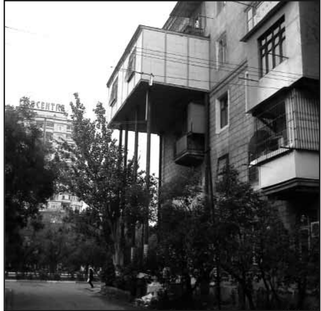
Bakı «xruşşovka»larından biri... Yüklədi: Mahir Məmmədli

Sizdə də maraqlı video, foto və ya səs yazısı varsa bizə göndərin. Materialı kompyuterinizdən yükləmə səhifəsinə daxil olmaqla, yaxud MMS kimi mobil telefondan yollaya bilərsiniz. Ehtiyac varsa anonimliyi təmin edirik.