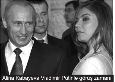
Alina Kabayeva Vladimir Putinlə görüş zamanı

Son illər Putinin arvadı ilə ictimaiyyət arasına çıxması nadir görüntü sayılır. 59 yaşlı baş nazirin adı tez-tez keçmiş Olimpiya gimnastı, Rusiya Dumasının yaraşlı üzlərindən olan Alina Kabayeva ilə də birgə çəkilir. Kreml bir vaxtlar Putinin ailəsinin xoş portretini yaratmağa da cəhd edib. Bu cütlüyün romantik dövrünü əks etdirən «Kadraxası öpüş» filmi 2008-ci ildə Valentin Günündə yayılıb.