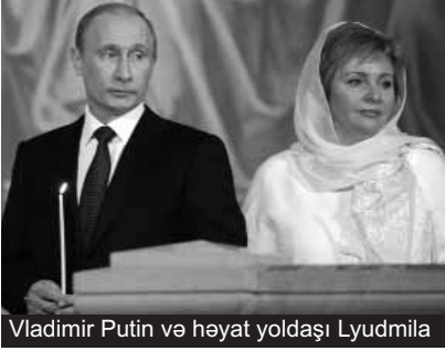
Vladimir Putin və həyat yoldaşı Lyudmila

Rusiyanın indiki baş naziri və mümkün gələcək prezidenti Vladimir Putinlə 28 illik həyat yoldaşı Lyudmilanın gah boşanması, gah da cütlük arasındakı sevgiyə dair zaman-zaman informasiyalar yayılıb. Ola bilsin