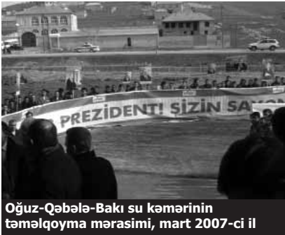
Oğuz-Qəbələ-Bakı su kəmərinin təməlqoyma mərasimi, mart 2007-ci il

İqtisadçı misal da çəkir ki, 370 milyon manata başa gələcəyi bildirilən Oğuz-Qəbələ-Bakı su kəmərinin çəkilişinə indiyə qədər 1 milyard dollara yaxın pul