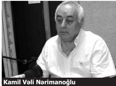
Kamil Vəli Nərimanoğlu

zadədən sonra Rafiq Əliyev Azərbaycanın ən böyük alimidir. Ona qarşı bu haqsızlıq, hakimiyyətin Məhəmməd Əmin Rəsulzadəyə, Üzeyir Hacıbəyliyə göstərdiyi haqsızlığın davamıdır. Azərbaycan xalqı bir qrup dağıdıcı qüvvənin əlindədir. Azərbaycanda artıq bütün yaltaqlanmayan ziyalılara qarşı bir hücum