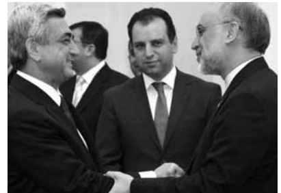
İran Ermənistanla viza rejiminin qaldırılmasını istəyir