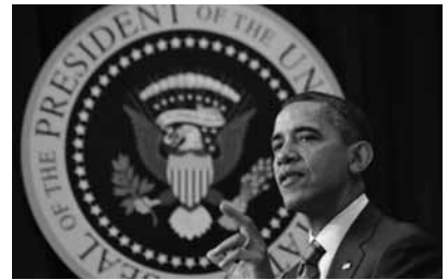
Obama: «Avrozonada hələ çox işlər görülməlidir»