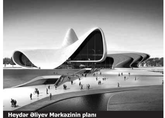
Heydər Əliyev Mərkəzinin planı

Siyahı bununla bitmir. Qusardakı turizm mərkəzinin tikintisinə indiyə qədər 500 milyon manatdan artıq pul xərclənsə də, gələn ilin büdcəsində bu layihəyə yenə vəsait ayrılması nəzərdə tutulur. 2012-ci ilin büdcəsində investisiya layihələrinə ən çox vəsait