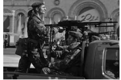
Ermənistan hərbi büdcəsini artırır