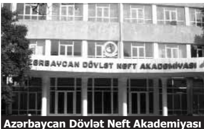
Azərbaycan Dövlət Neft Akademiyası

Azərbaycan Dövlət Neft Akademiyasının tərbivəvi işlər üzrə prorektoru Qasım Məmmədov noyabrın 10-da «Media forum» saytına müsahibə verib.