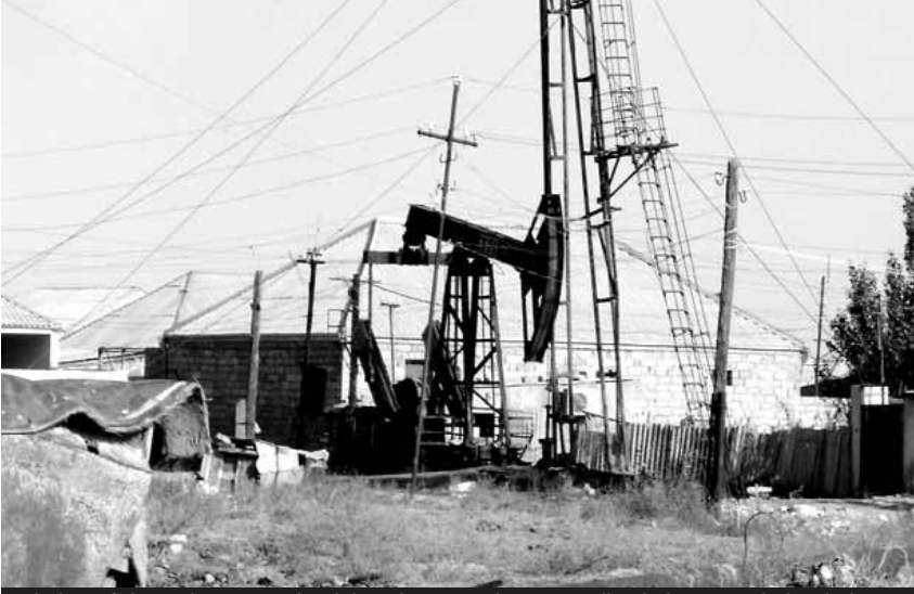
Bakıda neft buruqları arasında tikilmiş bu cür evlərin sənədləşdirilməsi sual altındadır.

«Dünən bələdiyyədən gəlmişdilər, evi sənədləşdirmək üçün sənədləri yığırdılar. Qonşularımız da nə vaxtdır sənədlərini veriblər, hələ də xəbər yoxdur. 3 ilə yaxındır burda yaşayırıq, evi hələ də sənədləşdirib bir tərəfə çıxarda bilmirik». Bu, Suraxanı rayonu ərazisində yeni salınmış Şimal-Şərq yaşayış massivinin sakini Azər Fərəcovdur.