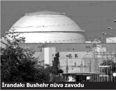
İrandakı Bushehr nüvə zavodu

Britaniyanın Xarici İşlər naziri William Hague deyib ki, "İranla mübahisə təhlükəli həddə çatıb". "Münaqişə riski böyüyür". O bildirib ki, Britaniya hökuməti yaxın vaxtlarda İrana qarşı birtərəfli sanksiyalarını elan edəcək. Sanksiyalar İranın "maliyyə, neft-qaz sektoruna və nüvə proqramı ilə bağlı fərdlərə qarşı yönələcək". Fransanın Xarici İşlər naziri Alain Juppe deyib ki, Fransa BMT-nin Təhlükəsizlik Şurasının çağırılmasını və İrana qarşı yeni sanksiyaların müzakirə olunmasını istəyib.