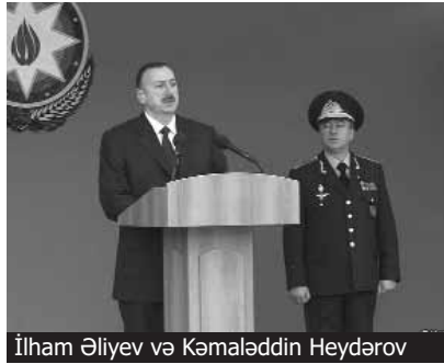
İlham Əliyev və Kəmaləddin Heydəröv

Müxalifət dişsizdir, ancaq bu, o demək deyil ki, siyasət ölüb. Bunu bir rəsmi deyir. Siyasət sistemdə bir neçə oliqarx qrupların balanslaşdırılmasında özünü göstərir. Klan maraqlarına vasitəçilik edən əsas fiqur Prezident Administrasiyasının 73 yaşlı rəhbəri Ramiz Mehdiyevdir. O, Heydər Əliyevin vaxtında da həmin vəzifədə olub və məhz Heydər Əliyev ona oğlunu hakimiyyətdə saxlamağı etibar edib.