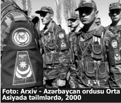
Azərbaycan ordusu Orta Asiyada təlimlərdə, 2000