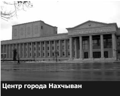
Центр города Нахчыван