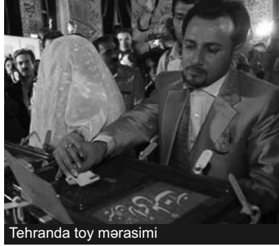
Tehrandə toy mərasimi

«İrana qayıdanda başımı bağlayırdım, rüpus geyirdim. Bunsuz İranda bir addım atmaq olmaz. İranda ər evində cəmi 7 ay qala bildim. Ərim