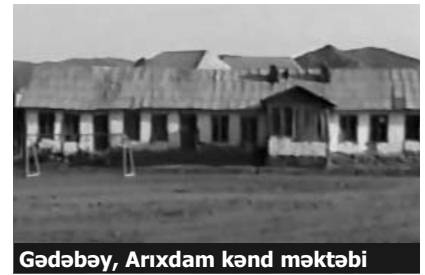
Gədəbəy, Arıxdam kənd məktəbi