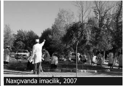
Naxçıvanda iməcilik, 2007