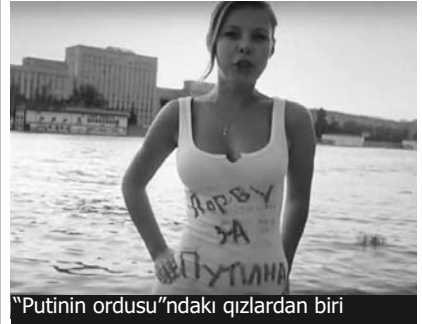
«Putinin ordusu»ndakı qızlardan biri

İnternetdə sosial şəbəkələrdə peyda olan bir dəstə qız Rusiyanın Baş naziri «Vladimir Putin üçün hər şeyi parçalamağa» hazır olduqlarını bildirirlər. Özlərini «Putinin ordusu» adlandıran qızlar bildirirlər ki, bu aksiya ilə Putini hər kəsin, o cümlədən də gözəl, gənc və ağıllı qızların dəstəklədiyini nümayiş etdirməyə çalışırlar: «Biz bir məsələdə həmfikirik ki, Putin layiqli, təmiz siyasətçi və ecəzkar kişidir. Hədəfimiz Putinin prezident olmasıdır.»