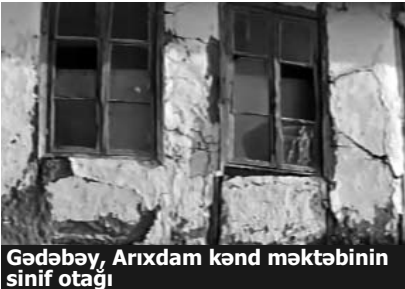
Gədəbəy, Arıxdam kənd məktəbinin sinif otağı