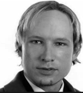
Anders Behring Breivik

İyulun 22-də Norveç paytaxtında dal-badal iki terror aktı törədilib. Əvvəlcə Oslonun mərkəzindəki hökumət binaları kompleksini yaxınlığında partlayış olub. 7 nəfər ölüb, 19 nəfər yaralanıb.