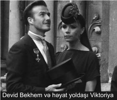
David Bekhem və həyat yoldaşı Viktoriya

Futbol ulduzu David Bekhemın bir sözü 1960-cı ildə çap edilmiş romanın satışını iki dəfə artırıb. O, Facebook səhifəsindəki qeydlərində yenidən doğulan qızına niyə