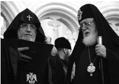
Erməni katalikosu Garegin və Patriarx II İlya, Tbilisi, 10 iyun 2011

Erməni Apostol Kilsəsi Gürcüstan Pravoslav Kilsəsinin başçısı Patriarx II İlyanın erməni katalikosu II Garegin haqqında dedikləri “uyğunsuz” fikirləri tənqid edib. Bu haqda AzadliqRadiosunun erməni xidməti məlumat yayıb. Məlumatla görə, ötən bazar günü