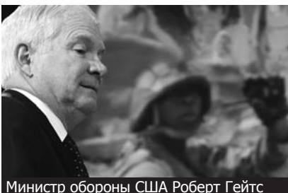
Министр обороны США Роберт Гейтс

Министр обороны США Роберт Гейтс признал факт участия американских официальных лиц в предварительных переговорах с движением Талибан, направленных на поиски политического разрешения конфликта в Афганистане. Вместе с тем Гейтс добавил, что не ожидает значительного прогресса во внутриафганском урегулировании в ближайшие месяцы.