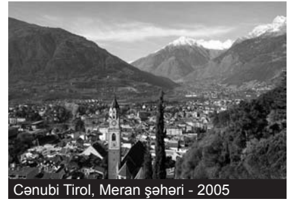
Cənubi Tirol, Meran şəhəri - 2005

Bu gün Cənubi Tirol 220 min almandillilərin, həm də italyandillilərin hüquqları qorunur. Cənubi Tirolun geniş qanunverici və idarəetmə hüquqları var, xalq və kənd təsərrüfatı, turizm, dağ sənayesi, sosial və təhsil sahələrində qanunlar çıxarılaq həyata keçirilir. Digər