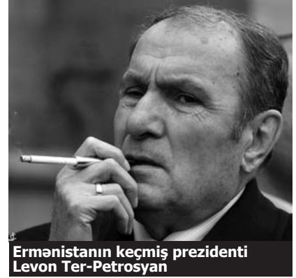
Ermənistanın keçmiş prezidenti Levon Ter-Petrosyan

- Belə bir variant var idi. Azərbaycanla Ermənistan arasında ərazi mübadiləsinə dair sənədlər də var. Orada nəzərdə tutulurdu ki, Qarabağ Ermənistanla bağlanır, Naxçıvan isə Meğri dəhlizi vasitəsilə Azərbaycanla. Amma mən bu variantı qəbul etmədim. Çünki strateji cəhətdən Ermənistanın İranla sərhədinin olması, hətta Qarabağdan da vacibdir. Bu variantda isə Ermənistanın İranla sərhədi əlindən çıxırdı. Təəssüf ki, son 13 ildə çox şey itirilib. İtirilən təkcə zaman və Ermənistanın inkişaf imkanları, ölkəni tərk edən insanlar deyil. Biz 1998-ci ildə münaqişənin həllinə yaxın idik. Əvvəl paket həll variantı var idi. Qarabağlılar onu qəbul etmədilər, Azərbaycan qismən razı idi, biz isə rəsmən razılığımızı vermişdik. O zaman ATƏT-in Minsk Qrupunun həmsədrləri həmin variantı