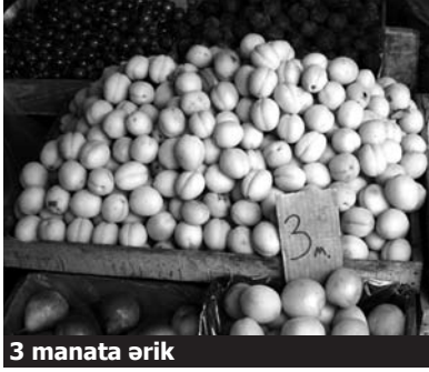
3 manata ərik