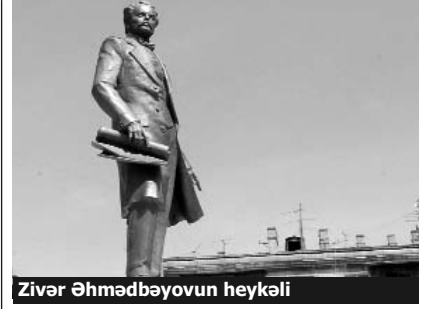
Zivər Əhmədbəyovun heykəli