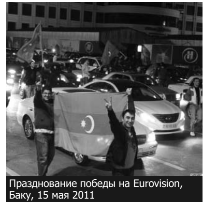
Празднование победы на Eurovision, Баку, 15 мая 2011

Тысячи журналистов, которые придут на Конкурс песни Eurovision-2012 в Баку должны знать, что правительство – хозяин этого конкурса, как правило, арестовывает журналистов. Средства массовой информации, которые будут транслировать это шоу на примерно 50 стран, должны помнить, что они ведут трансляцию из государства, которое ограничивает