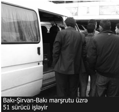
Bakı-Şirvan-Bakı marşrutu üzrə 51 sürücü işləyir

Verilişi tam olaraq AzadlıqRadiosu.az saytında dinləyə bilərsiniz. Şahnaz Bəylərqızı, Kamran Mahmudov