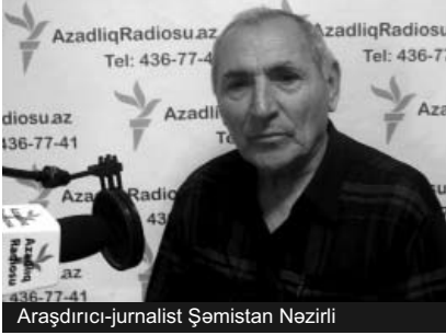
Araşdırıcı-jurnalist Şəmistan Nəzirli