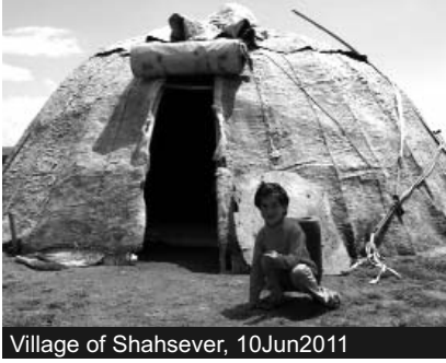
Village of Shahsever, 10Jun2011

İranın Şimal-Qərbində yerləşən Savalan dağı Ərdəbil Ostanlığının hər yerindən görünür. İranın ən hündür dağlarından biri olduğu