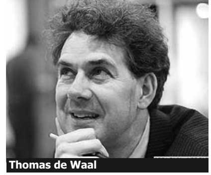
Thomas de Waal

edilə bilər? Bu, çox mürəkkəb məsələyə oxşayır.