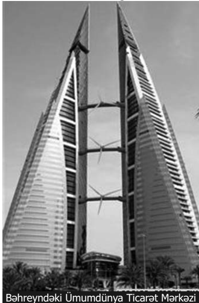
Bəhreynəndəki Ümumdünya Ticarət Mərkəzi

Bu əkizlər necəyə başa gəlib? Layihələşdirmə də daxil olmaqla 150 milyon dollara. Bina 2008-də tikilib. ARDNŞ-in 230 milyonluq əkizlərindən 80 milyon ucuz. Amma bir fərq də var. 150 milyon dollara binanın külək generatorları ilə