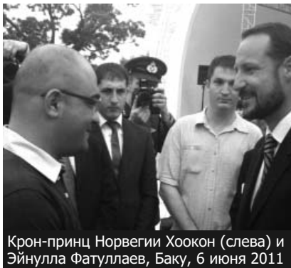
Крон-принц Норвегии Хоокон (слева) и Эйнулла Фатуллаев, Баку, 6 июня 2011

Вечером 6 июня крон-принц Норвегии Хоокон, во время приема в его честь в Государственной филармонии