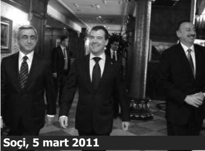
Soçi, 5 mart 2011