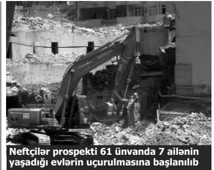
Neftçilər prospekti 61 ünvanında 7 ailənin yaşadığı evlərin uçurulmasına başlanılıb