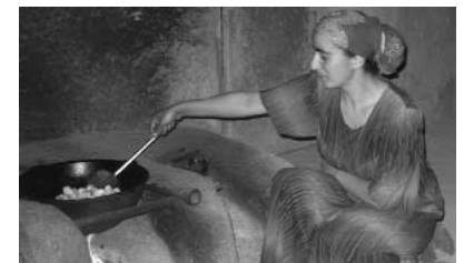
Sözəbaxan Qadınlar Klubu