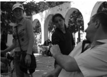
Dilənçilər arasında 3-4 yaşdan tutmuş 12-14 yaşa qədər yeniyetmələrə rast gəlmək olur

Onu başa salmaq istədim ki, polis deyilik, jurnalistik. Lakin əlini tovlayıb getdi. «Hamısı birdir», - dedi. Sonradan öyrəndim ki, vaxt tapıb dərəcə də gedir. İki bacısı və bir qardaşı yaxınların himayəsində yaşayırlar. Himayədə yaşadığı ailə də kasıbdır.