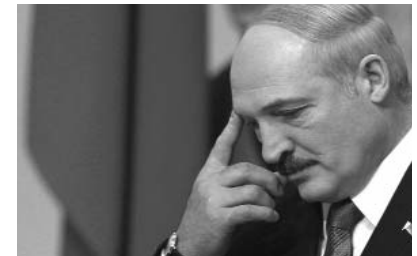
Belarus hər yerdən borc istəyir