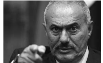
Yaralanmış Yəmənin prezidenti Səudiyyə Ərəbistanına gedib