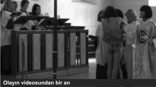
Olayın videosundan bir an

Onlar gözlərinə inana bilmirdilər. Oslonun Baş kilsəsinə toplaşanlar müqəddəs "Kristi himmelfart" (İsanın səmaya yüksəlməsi) günündə dua etmək istəyirdilər. Lakin gözlənilmədən 2 çılpaq gənc kilsəyə girərək düz minbərin altında sekslə məşğul olmağa başladı. Kilsə əməkdaşları onları az qala zorla bir-birindən ayırdılar. Bu zaman daha bir çılpaq kişi kilsəyə girir. Kilsədən kənara çıxarılan gəncləri polis həbs edir.