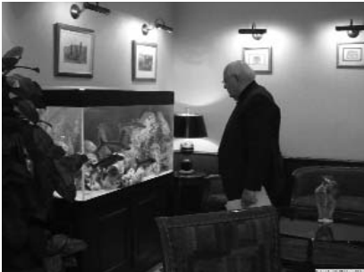
Михаил Горбачев в Горбачев-фонде

20 лет назад, 5 июня 1991 года, президент СССР Михаил Горбачев выступил с Нобелевской лекцией об обновленном Советском Союзе и его роли в обновленном мире. "Мы пошли на крупные и, может быть, самые значительные в XX веке преобразования - для своей страны, для ее народов. Но - и для всего мира", - сказал тогда Горбачев.