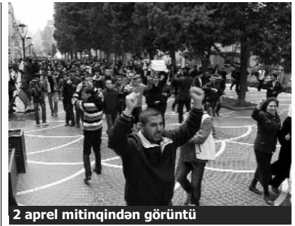
2 aprel mitinqindən görüntü