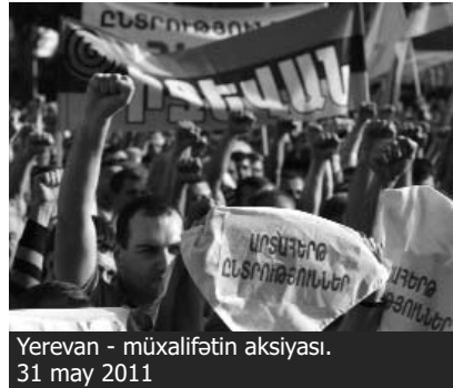
Yerevan - müxalifətin aksiyası. 31 may 2011

Mayın 27-də Ermənistan hakimiyyəti həbsdəki siyasi rəqiblərinə amnistiya verib. Amnistiya son nəticədə 400 nəfərin azadlığa çıxması ilə nəticələncək.