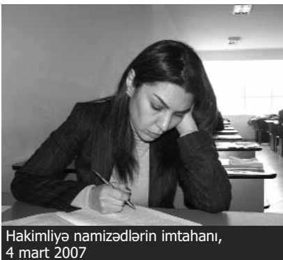
Hakimiyyətə namizədlərin imtahanı, 4 mart 2007