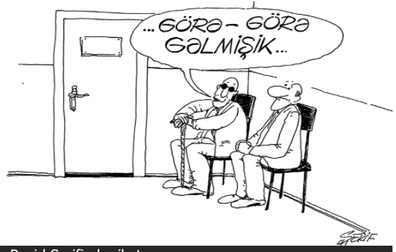
Rəşid Şerifin karikaturası

Azərbaycan siyasi səhnəsində, etdiyi cinayətlərdən, xəyanətlərdən asılı olmayaraq, heç kəs ortadan qalxmır. Hamı ortadadır. Və hamı danışıq. Yaranan qarışıqlığı təsəvvür edə bilərsiniz? Oğru da, doğru da eyni qətiyyətlə bağıranda, toplum öz siyasi oriyentirini itirir. Nəticəsi? Pis addımla yaxşı addım, məhrumiyətə dözməklə xəyanətin nəticəsi eynidirsə, siyasi aktyorların riskə getməyi üçün ciddi bir motiv olmur. Deməli, birmənalı addımlar atmağa tələsmək lazım deyil, ən pis qüvvə ilə də körpüləri yandırmaq düzgün deyil (birdən təkləndin?). Xalqa xəyanətin də bir elə ağır bədəli yoxdur (5-6 ilə hamı hər şeyi yaddan çıxarır). Beləcə bütün siyasi