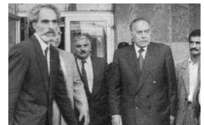
Gəncə qiyamını doğuran səbəblər nə idi?