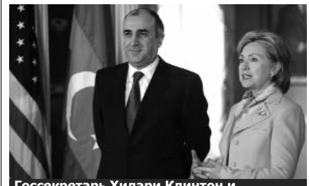
Госсекретарь Хилари Клинтон и министр иностранных дел Эльмар Мамедъяров, 5 мая 2009

Министр иностранных дел Азербайджана Эльмар Мамедъяров, находящийся с визитом в Вашингтоне, встретился с Государственным секретарем США Хилари Клинтон. В коротком заявлении для прессы еще до встречи Клинтон отметила, что взаимоотношения США и Азербайджана имеют стратегическое значение и сотрудничество между странами укрепляется: