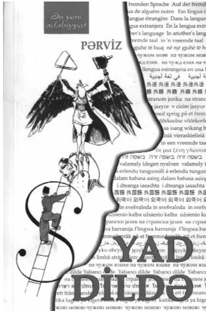
Birinci yeri "Yad dildə" romanı qazandı