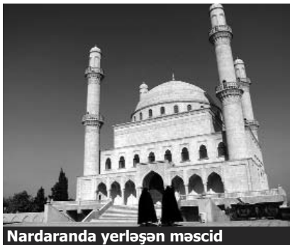
Nardaranda yerləşən məscid

Milli Məclis «Dini etiqad azadlığı haqqında» qanuna iyirmiyədək dəyişiklik etməyə hazırlaşır. Qanun layihəsinə görə, islam icmaları Qafqaz Müsəlmanları İdarəsinə hesabat verəcəklər. Bundan başqa, dini qurumlara dini mərkəz və idarələr rəhbər təyin edəcək və yalnız bundan sonra fəaliyyət göstərə bilirlər. Daha bir dəyişiklik isə dini icmanın qeydiyyatına alınması ilə bağlıdır. İndi qeydiyyat üçün 10 nəfərin müraciəti yetərlidirsə, yeni qanun layihəsinə görə, 50 nəfər müraciət etməlidir.