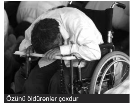
Özünü öldürənlər çoxdur

- «2001-ci ildə biz statistikanı aparmışdıq. O vaxt 40-a yaxın Qarabağ əlili intihar etmiş, ya da müalicəsizlikdən