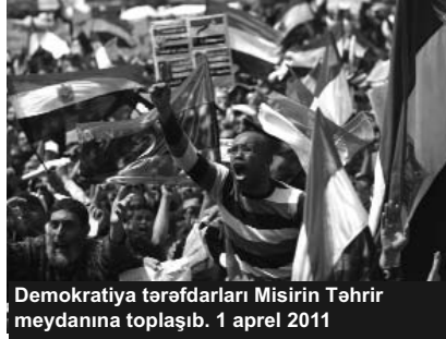
Demokratiya tərəfdarları Misirin Təhrir meydanına toplaşib. 1 aprel 2011

Eyni zamanda idealistlər faşizmin liberal Qərb cəmiyyətinə təhlükəsi ilə bağlı həyəcan təbili çalmış və dərhal Avropanın demokratik ölkələrinin müdafiəsinə qalxmağa çağırmış, Amerikanın təhlükəsizliyinin onların mövcudluğundan asılı olduğunu bildirmişdilər.