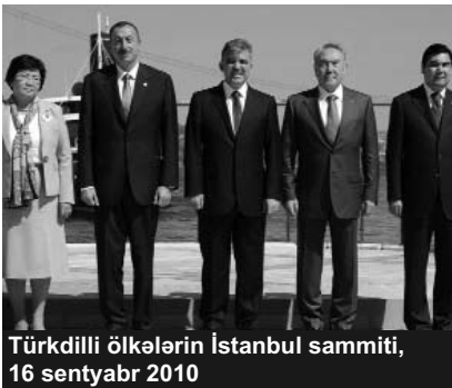
Türkdilli ölkələrin İstanbul sammiti, 16 sentyabr 2010

Türkiyənin baş naziri R.T.Ərdoğan bu günlərdə maraqlı təkliflə çıxış edib. O bildirib ki, türk dövlətləri arasında Şengen sazişinə bənzər sazişin qüvvəyə minməsi çox yaxşı olardı. Baş nazir bu məqsədlə ölkəsinin digər dövlətlərlə danışıqlar aparacağına da işarə edib. Amma bir detalı qeyd etmək vacibdir ki, cənab Ər-