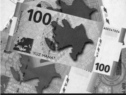
Azərbaycan -- Manat (code: AZN), the currency of Azerbaijan, 2009