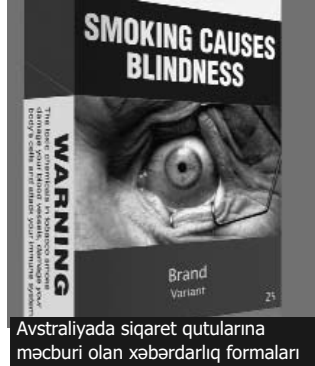
Avstraliyada siqaret qutularına məcburi olan xəbərdarlıq formaları

İlk dəfədir ki, dünyada xroniki və ya keçici olmayan xəstəliklərin vəziyyəti haqda global hesabat çıxıb. Bu xəstəliklərə o cümlədən xərçəng, şəkər, ürək və tənəffüs orqanları xəstəlikləri daxildir. 2008-ci ilin statistikasına görə, dünyada ölən 57 milyon adamdan 36 milyonu və ya 63 faizi bu xroniki xəstəliklərdən ölüb. Bunlardan da 17 milyonu ürək xəstəliyindən, 7,6 milyonu xərçəngdən, 4,2 milyonu tənəffüs xəstəliklərindən, 1,3 milyonu şəkər xəstəliyindən ölüb.