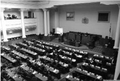
84 депутата «за» и ни одного «против» – парламент единогласно проголосовал за расторжение российско-грузинского соглашения

Грузия прервала действие соглашения об организации транзита через территорию страны военных грузов и персонала российских баз. С такой инициативой выступил президент страны, а парламент во вторник едино-