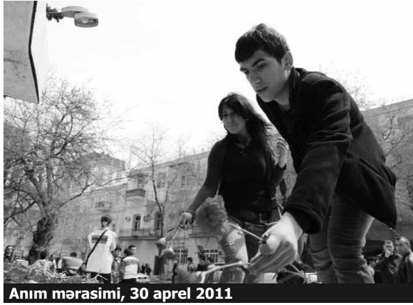
Anım mərasimi, 30 aprel 2011

Amma səhər tezdən ADNA yaxınlığında və 28 May metrosu ətrafında