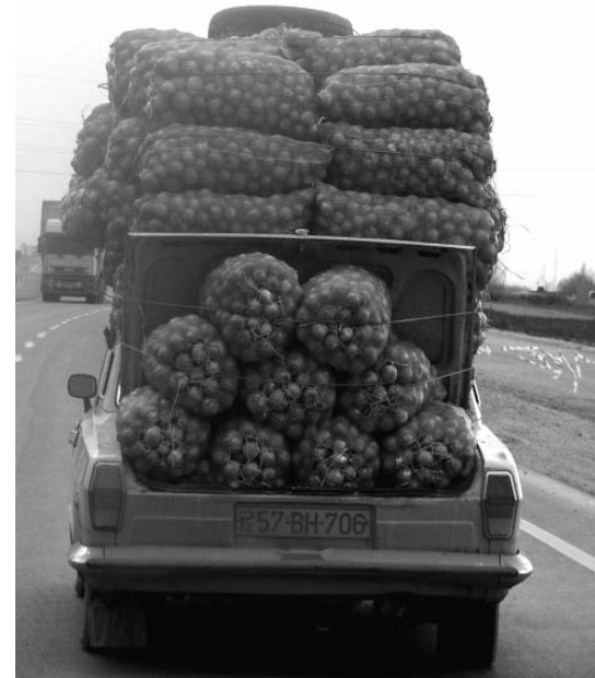
2 tona yaxın soğan daşıyır bu maşın... Yükləyib: Azər

Sizdə də maraqlı video, foto və ya səs yazısı varsa bizə göndərin. Materialı kompyuterinizdən yükləmə səhifəsinə daxil olmaqla, yaxud MMS kimi mobil telefondan yollaya bilərsiniz. Ehtiyac varsa, anonimliyi təmin edirik.