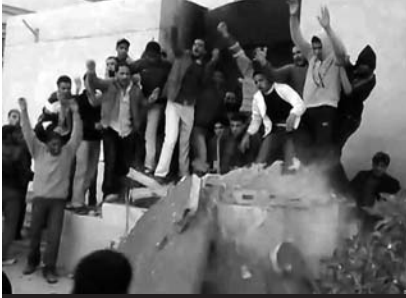
Liviya lideri Muammar Qaddafinin yaşıl kitab üstündə büstü uçurulur, 17 fevral 2011

LİVİYADA TOQQUŞMALARDA 100-dən ÇOX ADAM HƏLAK OLUB "Human Rights Watch" təşkilatı Liviyada nümayişlər dağıdırlarkən 100-dən çox adamın öldürüldüyünü xəbər verir. Təkcə Benqazi şəhərində 35 adam həlak olub. Bəzi məlumatlara görə, aksiyaçılar şəhərdəki hava limanını ələ keçiriblər. Həftə ərzində ölkənin azı 4 şəhərində etiraz aksiyaları və toqquşmalar müşahidə olunub. Amma hələlik paytaxt Tripolidə elə bir böyük gərginlik yaşanmır. Dövlət kütləvi informasiya vasitələri istənilən etiraz aksiyasının boğulacağını xəbərdarlıq edirlər. Facebook da daxil olmaqla ölkədə internet saytlarına blok qoyulub, bir neçə rayonda elektrik enerjisi kəsilib. Aksiyaçılar ölkədə islahatlar aparılmasını tələb edirlər. Liviya prezidenti Muammar Qaddafi 40 ildən çoxdur ki, hakimiyyətdədir.