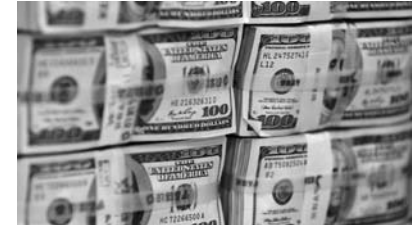
Milyardların yoxa çıxdığı Hindistan