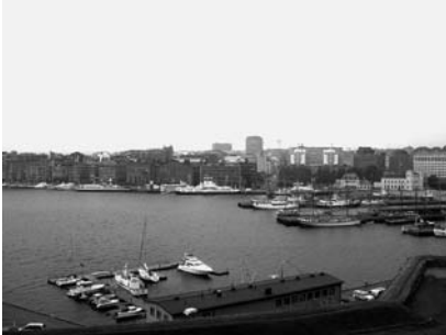
Oslodan dəniz gəzintisində çıxmaq qeyri-adi bir təəssürətdir...

Bilirsiz, Norveçin Azərbaycandan əsas fərqi nədir? Norveçdə neftin satışından gələn pulun bir kronunu da xərcləməirlər. Amma buna baxmayaraq, əhali ildən-ilə varlanır, insanların ömrü uzanır, təhsilin, səhiyyənin səviyyəsi qalxır. Bu cür insan inkişaf indeksinə görə, Norveç BMT-nin reytingində dünya ölkələri arasında birincidir.