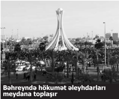
Bəhreynə hökumət əleyhdarları meydana toplaşır

Bəhreynə minlərlə nümayişçi şəhərin mərkəzi meydanına daxil olub. Xüsusi