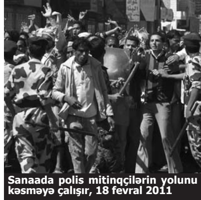
Sanaada polis mitinqçilərin yolunu kəsməyə çalışır, 18 fevral 2011

Şənbə günü Yəmən paytaxtı Sanaada prezident Ali Abdullah Salehin tərəfdar-