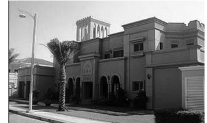
«The Washington Post» da Dubay mülkləri yada salındı