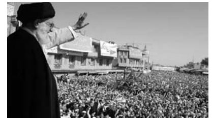
İran rejiminin də sonu çatıbmi?