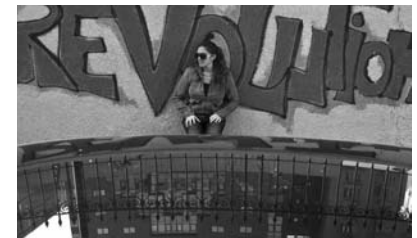
«Niyyə Yaxın Şərqdə geriye dönüş yoxdur?»