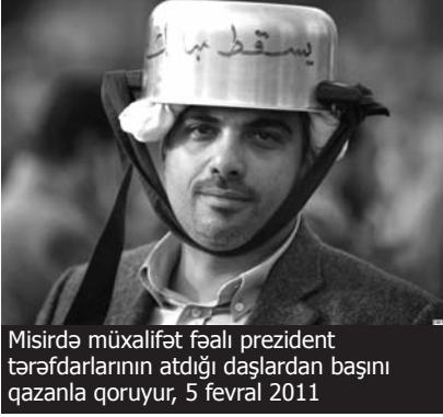
Misirdə müxalifət fəali prezident tərəfdarlarının atdığı daşlardan başını qazanla qoruyur, 5 fevral 2011