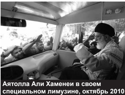
Аятолла Али Хаменеи в своем специальном лимузине, октябрь 2010

На пятничной проповеди в Тегеранском университете духовный глава Ирана