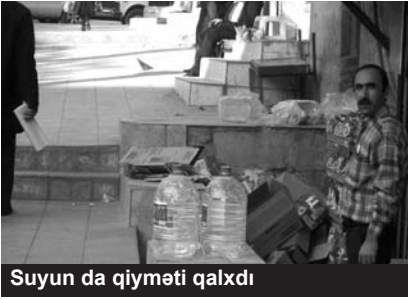
Suyun da qiyməti qalxdı

Tarif Şurası suyun, poçt və sərnişindəşımaya xidmətlərinin qiymətlərində artım nəzərdə tutan dəyişiklik edib. Bu, şuranın yanvarın 31-də keçirilən iclasında qərara alınıb.