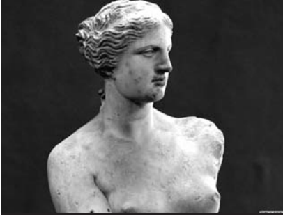
Romada Milli Muzeydə saxlanan Venera heykəli

Onlar özlərini hamıdan gizlətməyə çalışırlar. Onları tapmaq və söhbətləşməyə yola gətirmək üçün mənə günlər lazım oldu... Naturaçılar işlərinə Azərbaycanda «pis baxıldığını» deyib müsahibə verməyə meyl göstərmirdilər. Naturaçı – rəssama, heykəltəraşa, fotoqrafa və digər sənətcilərə poza verən modeldir. Onlar geyimli və ya çıpaq olur. İncəsənət məktəblərində tələbələrini naturaçıyla təmin edən ayrıca şöbə də fəaliyyət göstərir.